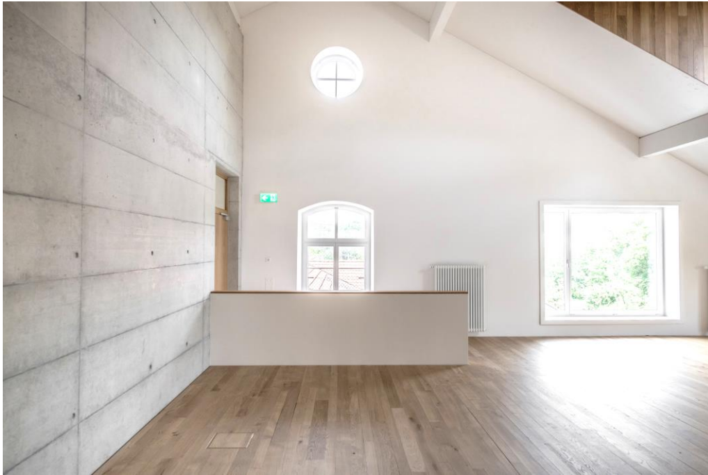
Mietfläche 2. OG