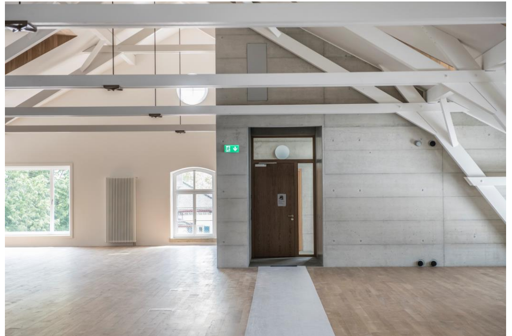
Mietfläche 2. OG