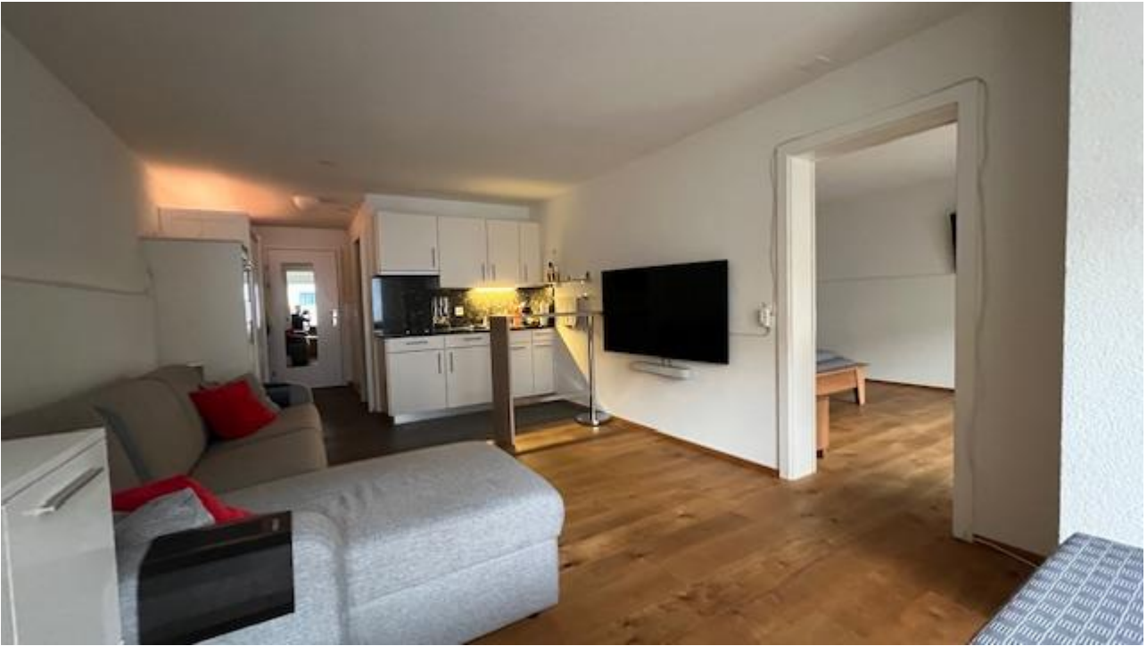
Wohnen / Küche