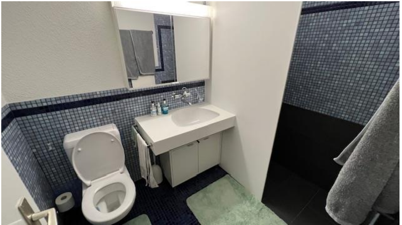
En Suite Badezimmer mit WC/Dusche