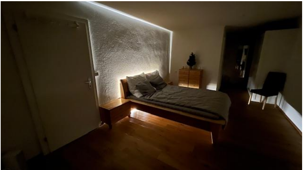
Schlafzimmer mit en Suite Badezimmer