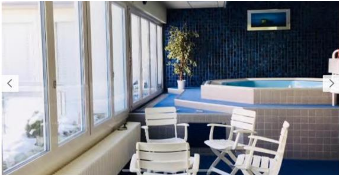
Wellnessbereich mit Whirlpool, 3 Saunas, Solarium und Fitnessgeräte