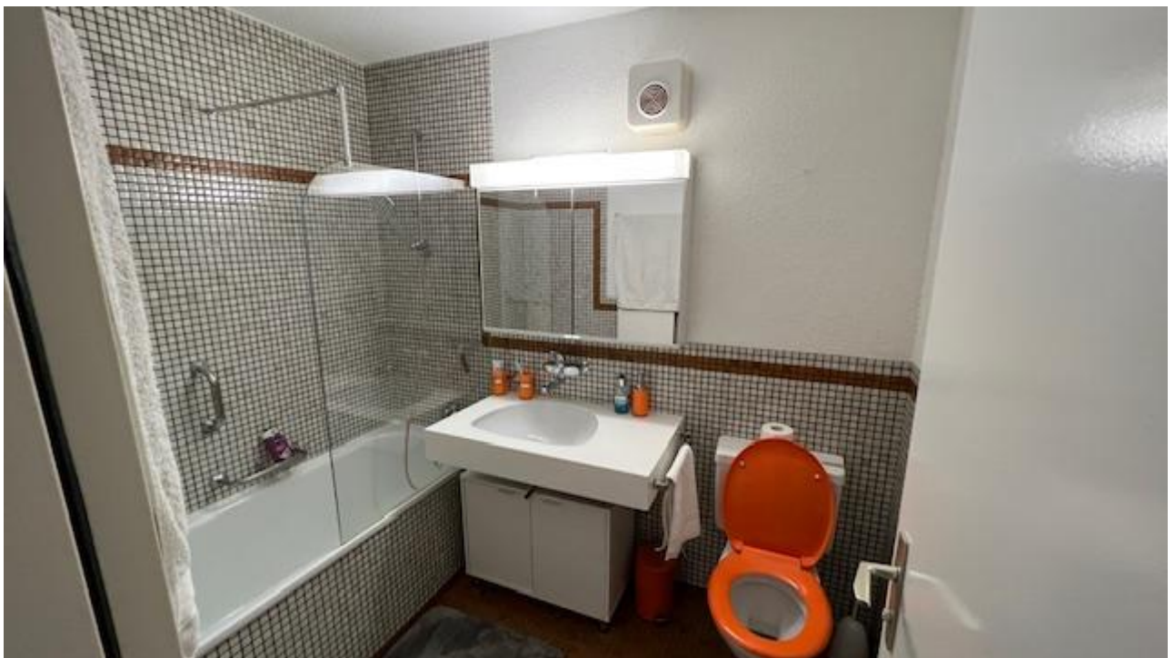
Gäste-WC mit Badewanne