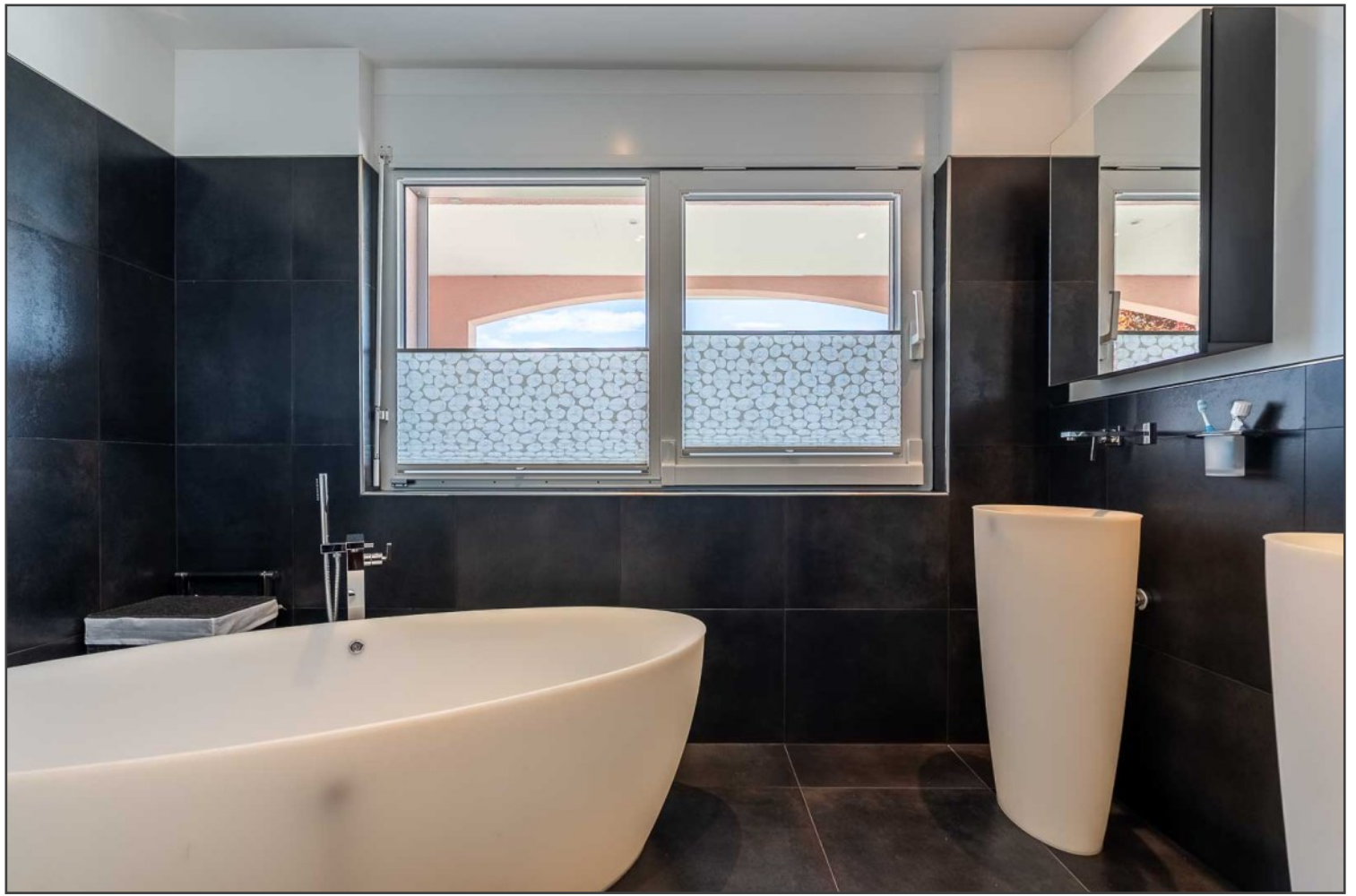
«baignoire, douche, WC et 2 vasques composent cette salle d'eau»