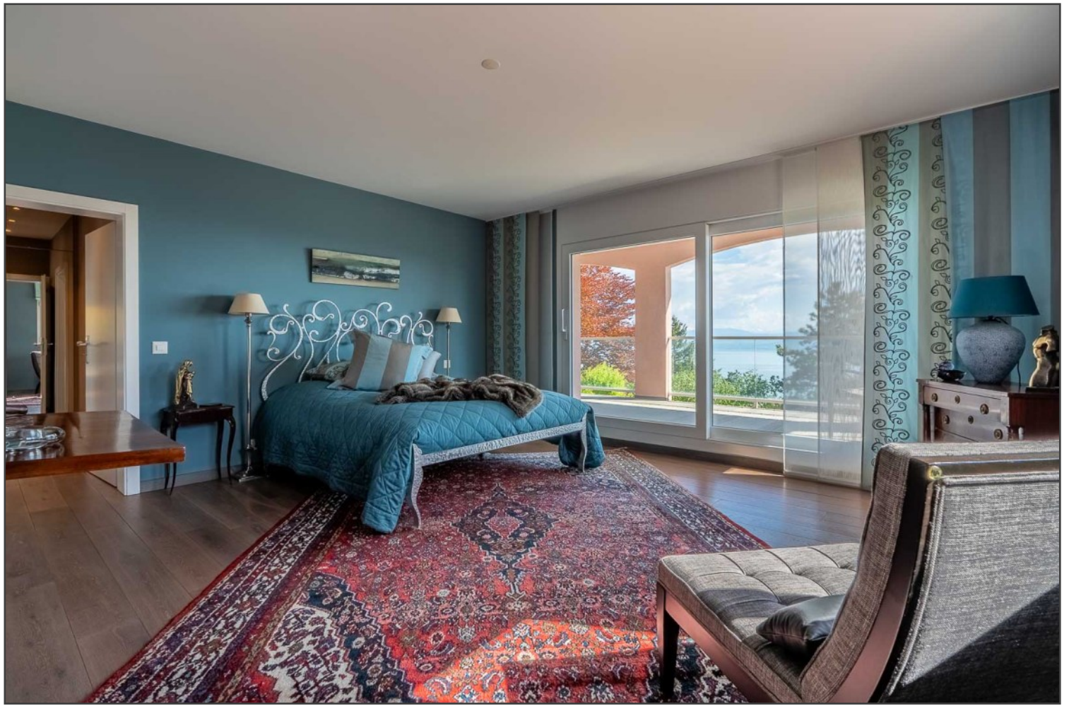
«la suite panoramique occupe l'entier de l'étage»