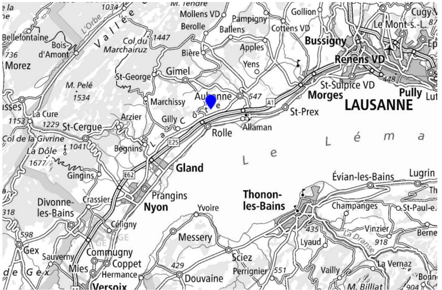
Perroy - chemin Sous-Bois 6