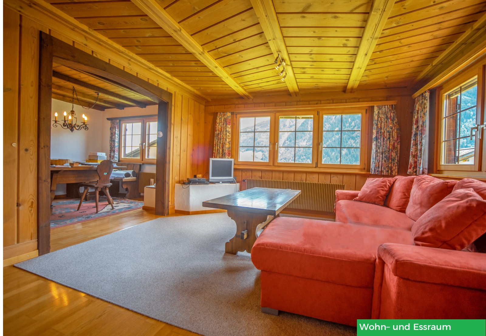
Wohn- und Essraum