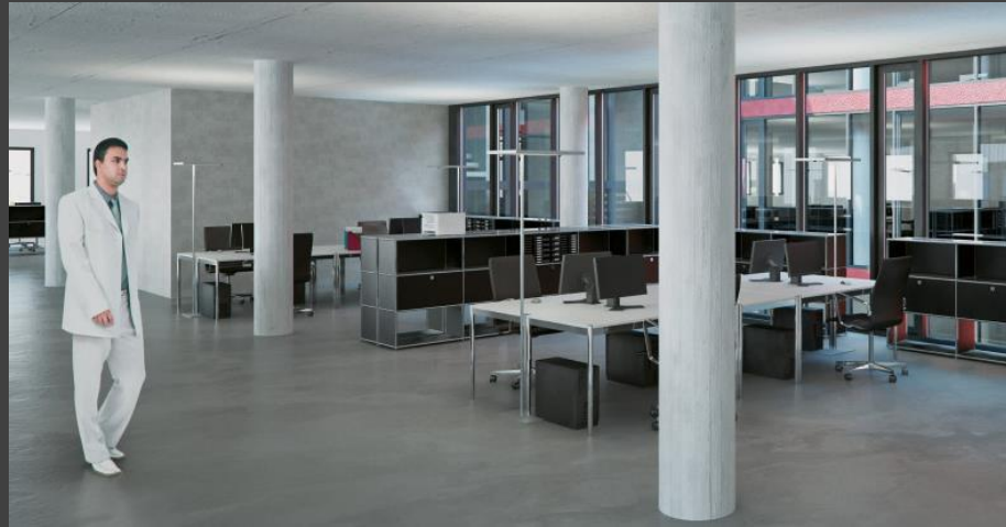
* Beispiel Transparenz zum Lichthof