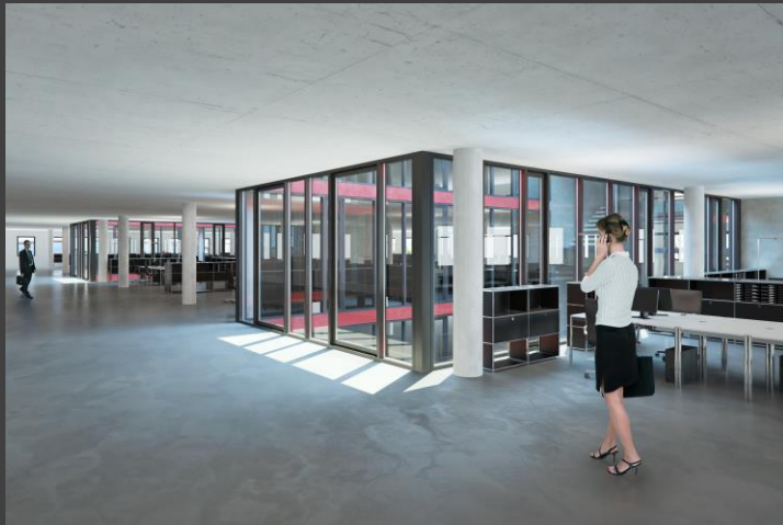
* Beispiel offene Raumbestaltung