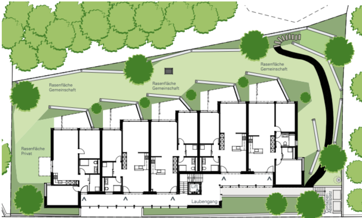
Ein- und Ausfahrt Tiefgarage