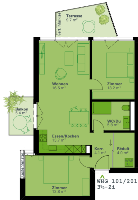
WHG 101/201 3½-Zi