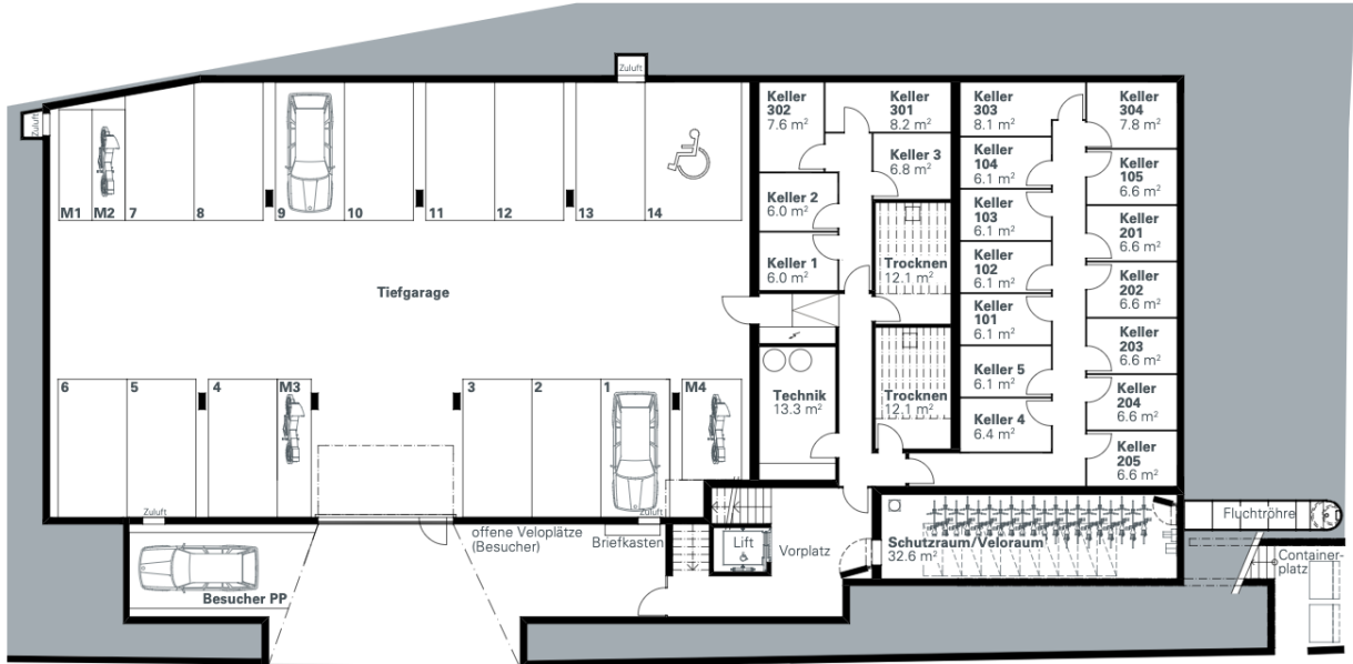
Ein- und Ausfahrt Tiefgarage