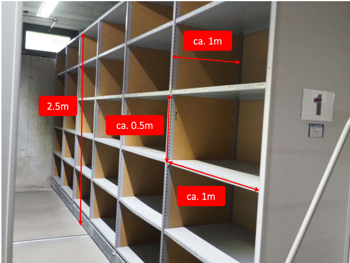
Abbildung 3: Abmessung Archiv