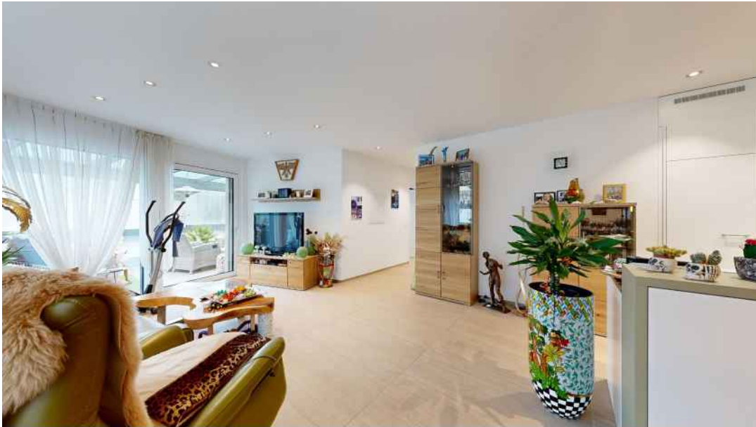
Hell, offen und einladend präsentiert sich der Wohn- / Essbereich.