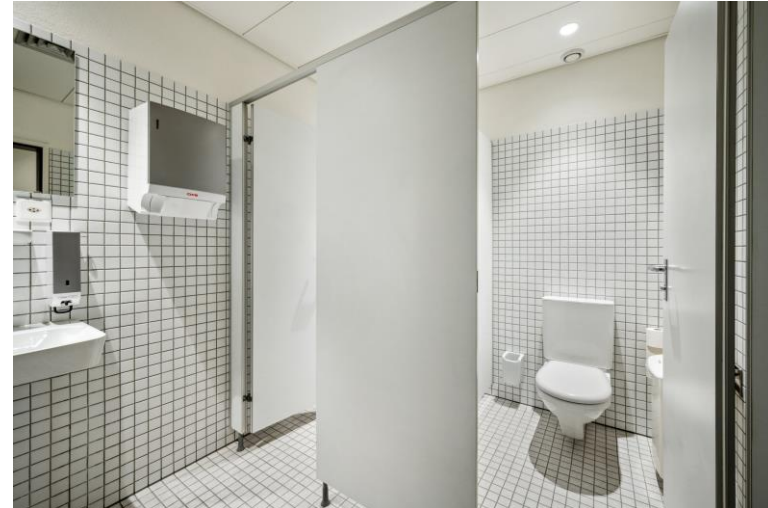
Toiletten zur Mitbenützung im 1. OG