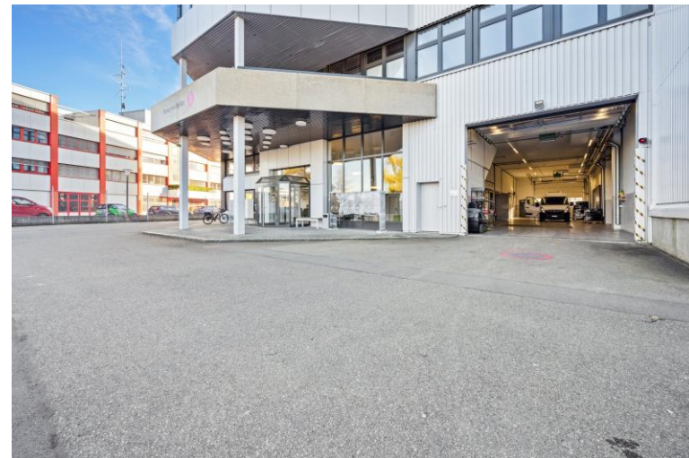
Haupteingang + Anlieferung