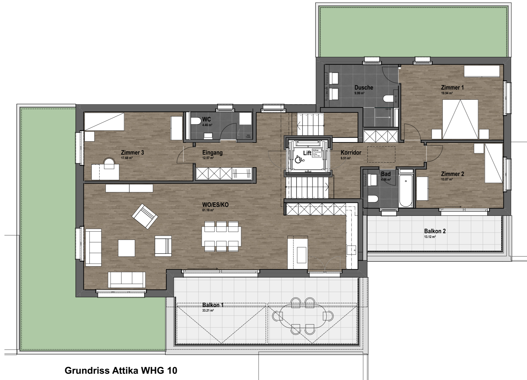
Grundriss Attika WHG 10