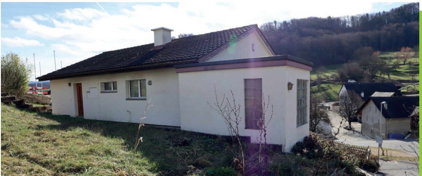
Eingangsfassade mit angrenzendem Wintergarten