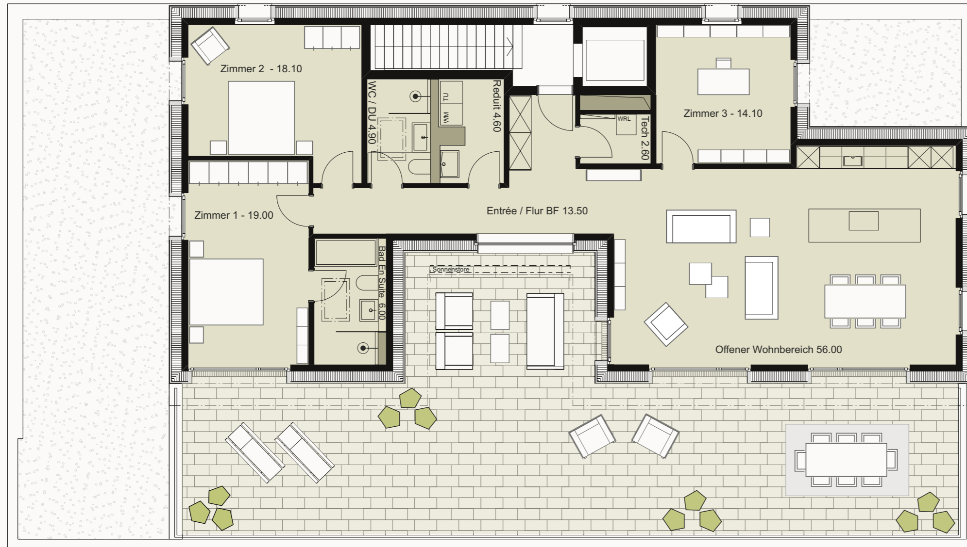
Südwest Terrasse mit geschütztem Atrium 108.70m2