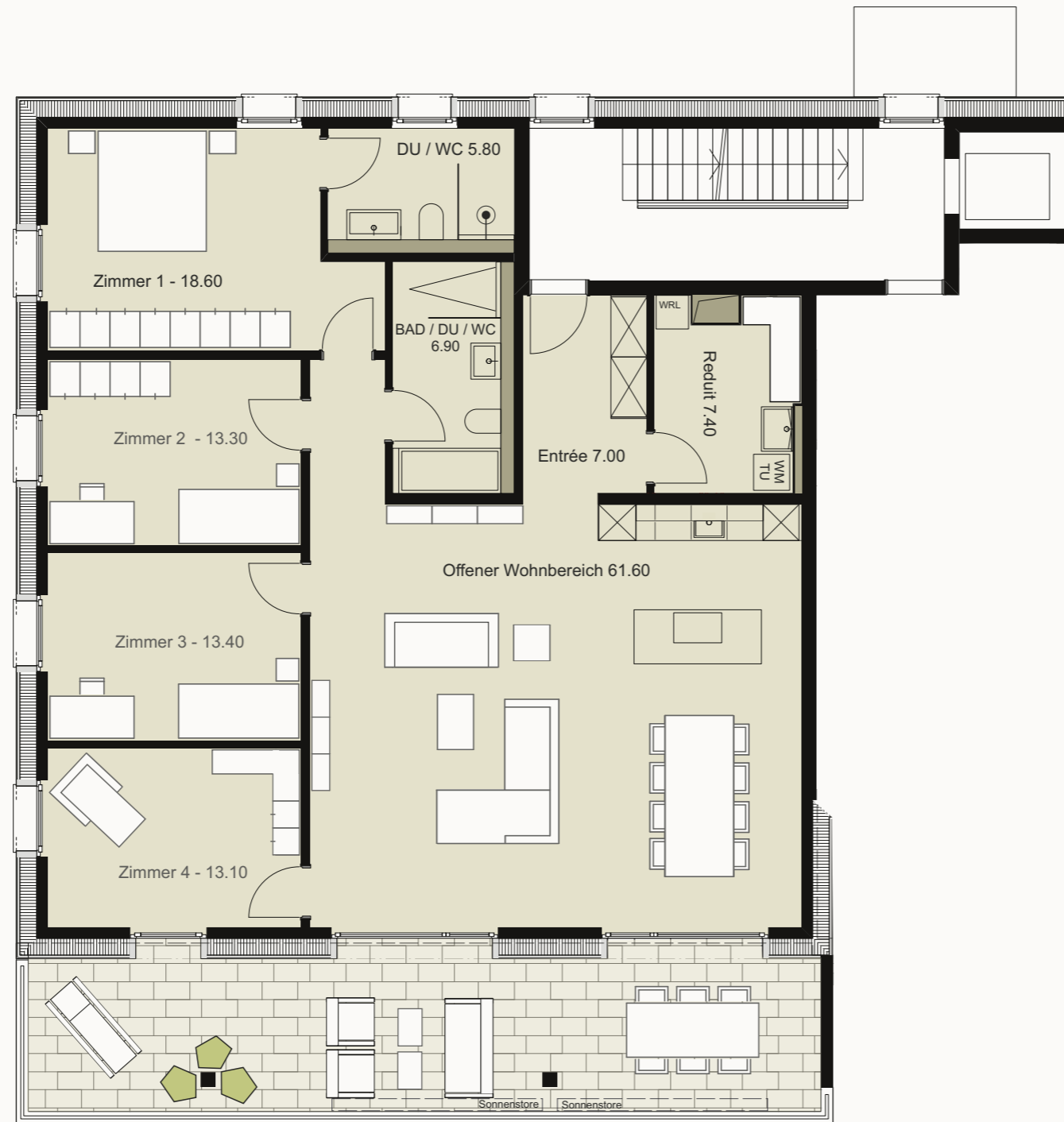
Gedekte Terrasse (Balkon) - 38.80 - Süd und Südwestausrichtung