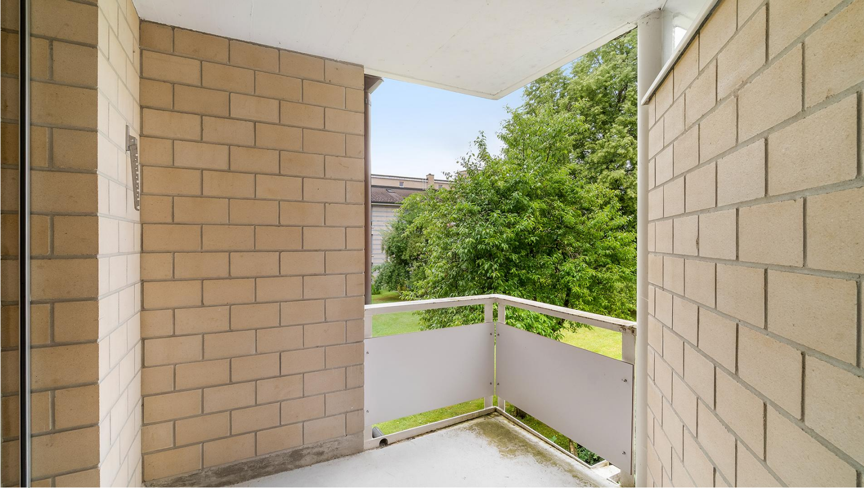
Balkon Südwest 6 m 2