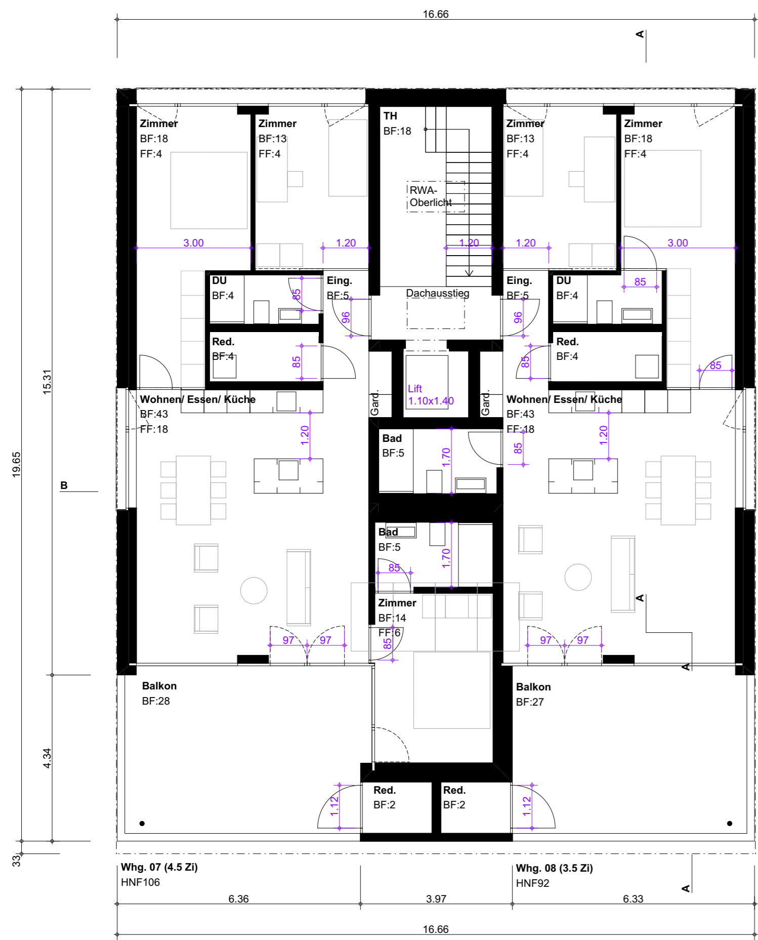
Grundriss 3. Obergeschoss