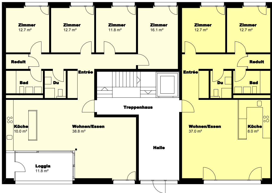
Grundriss M. 1:150