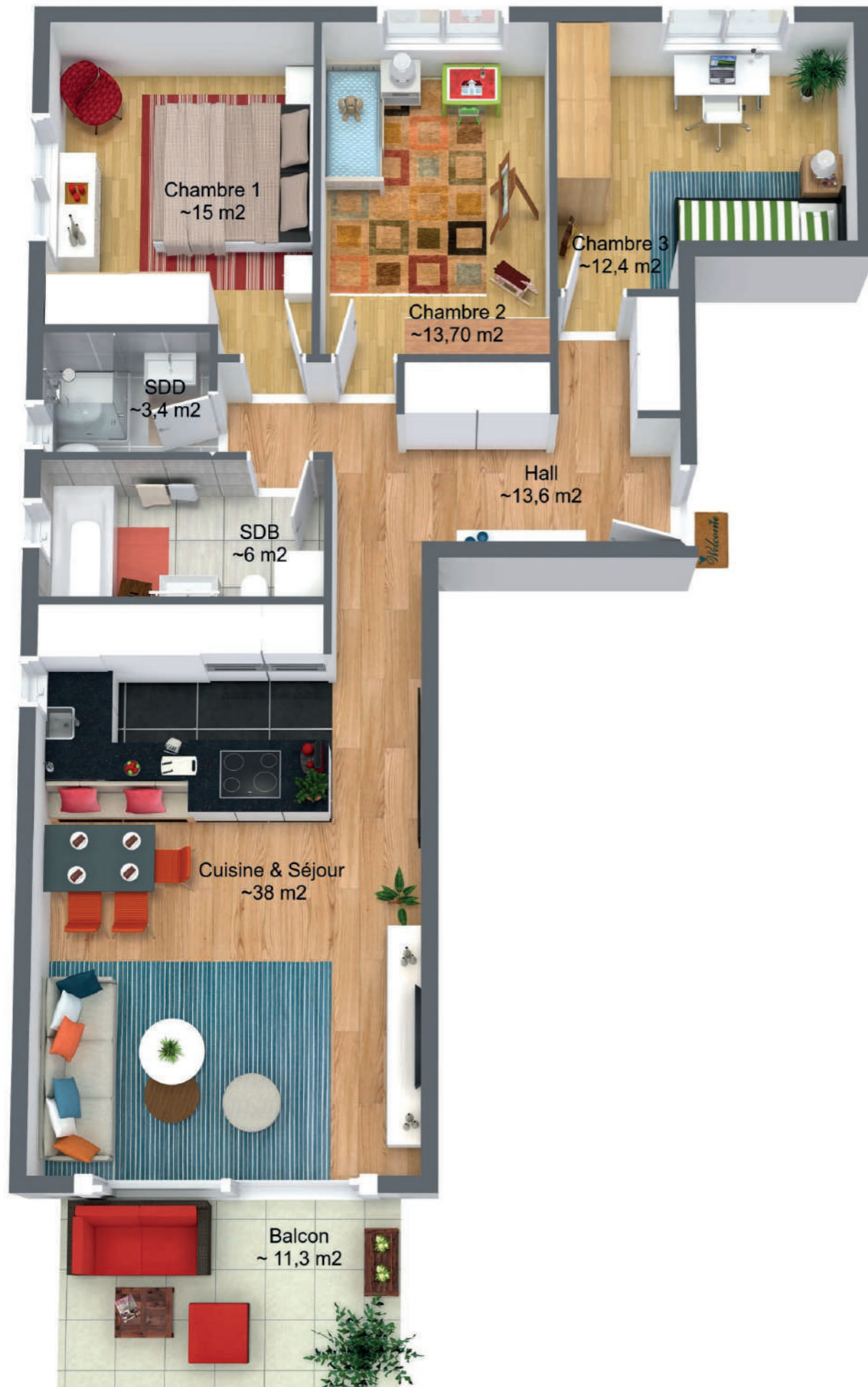
ILLUSTRATION 3D - PLAN