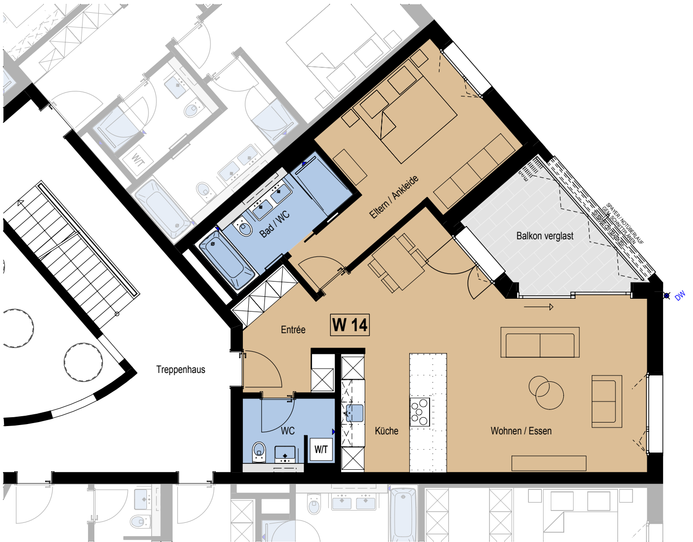
GRUNDRISS 1.OBERGESCHOSS 1:600