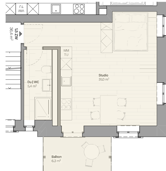
W21 | MST: 1:100