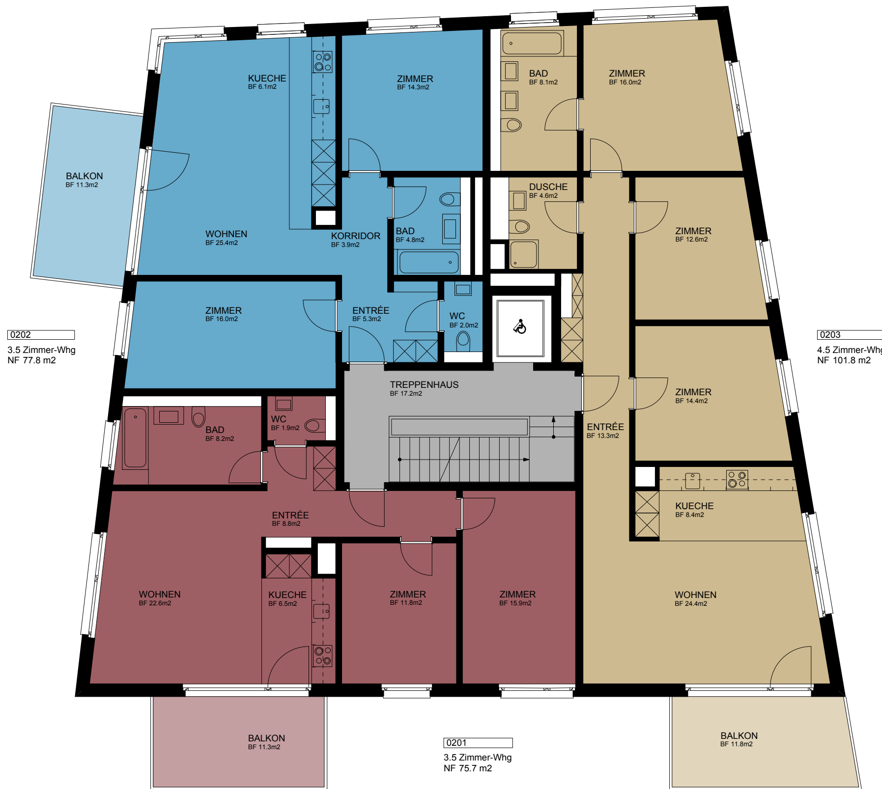
0202 3.5 Zimmer-Whg NF 77.8 m 2