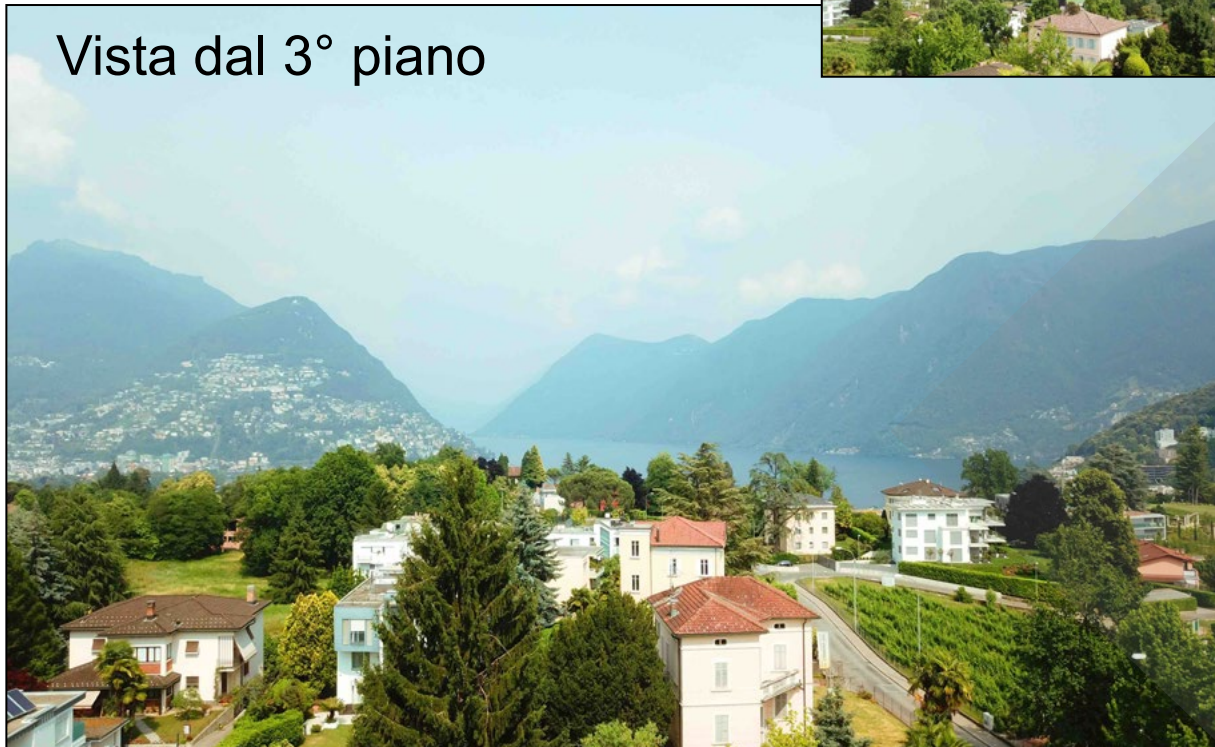
Vista dal 3° piano