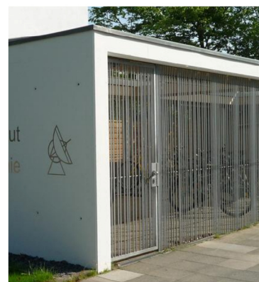
VELOS SICHTBETON / METALLVERKLEIDUNG