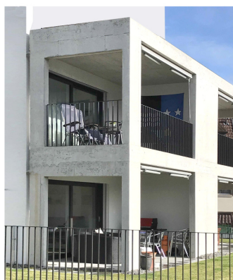
BALKONE SICHTBETON / GLASGELÄNDER