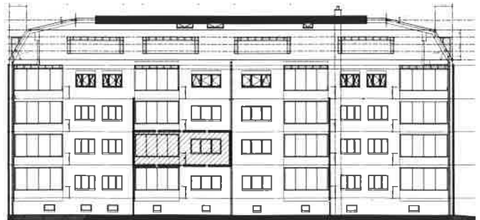
Fassade Süd-Ost - Strassenseitig - Masstab 1:300