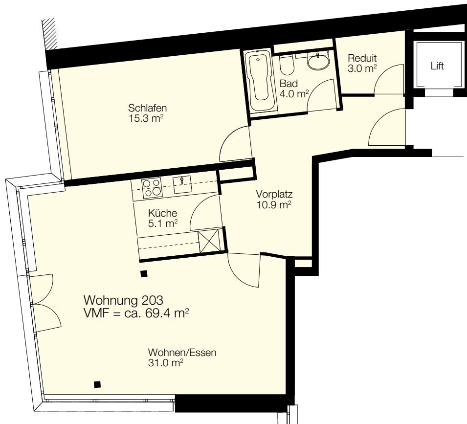
Grundriss Massstab 1:100