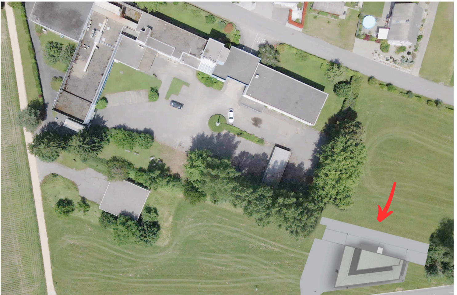
Vidéo drone interne - montage TASK5-S