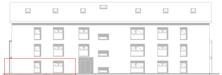
Façade Nord : 1:200