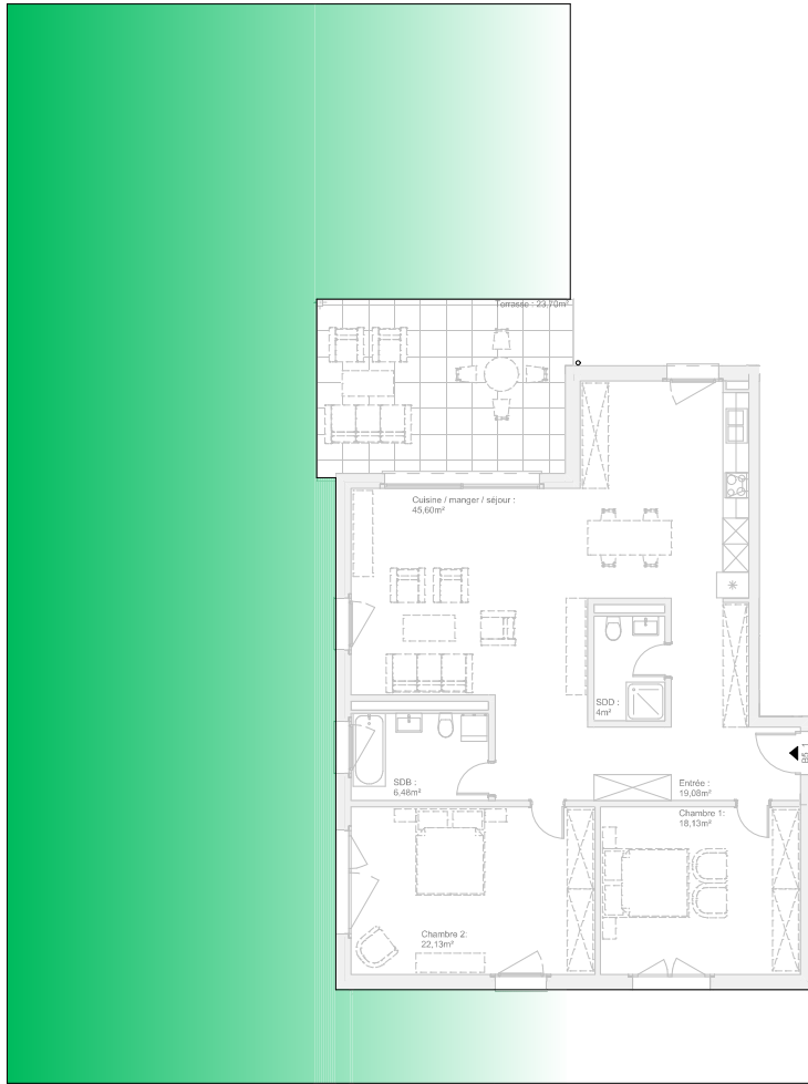
Rez-de-chaussée : 1:100