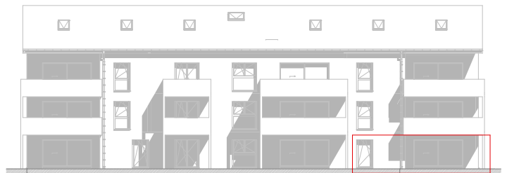
Façade Sud : 1:200