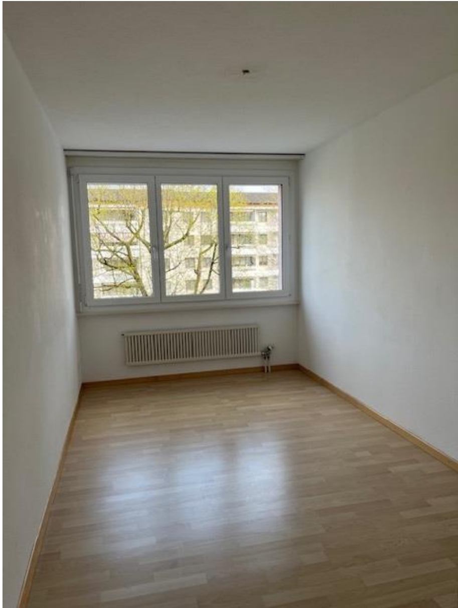
Schlafzimmer 1, 11.09 qm