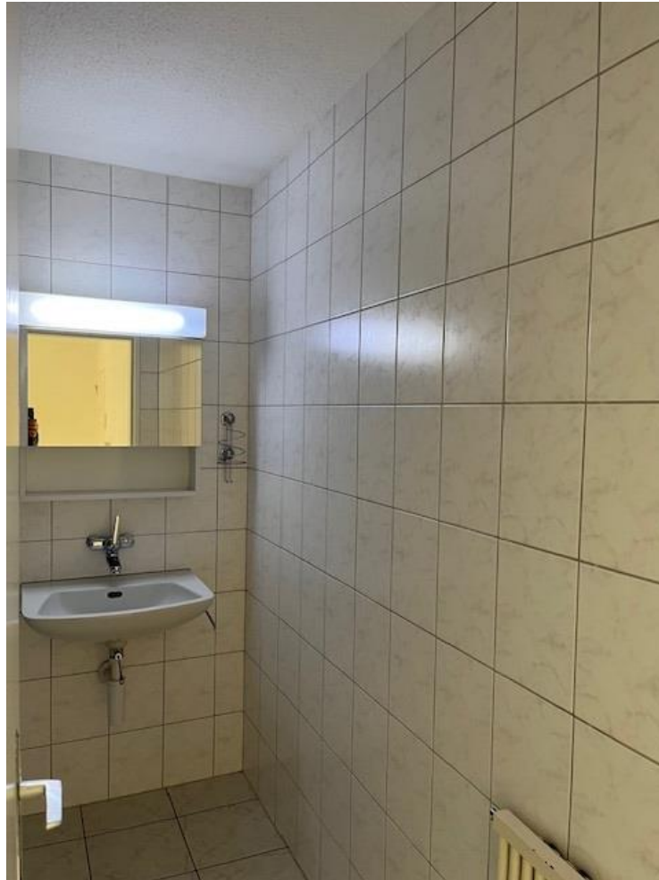
Bad, Waschmaschine und Tumbler von 11/24