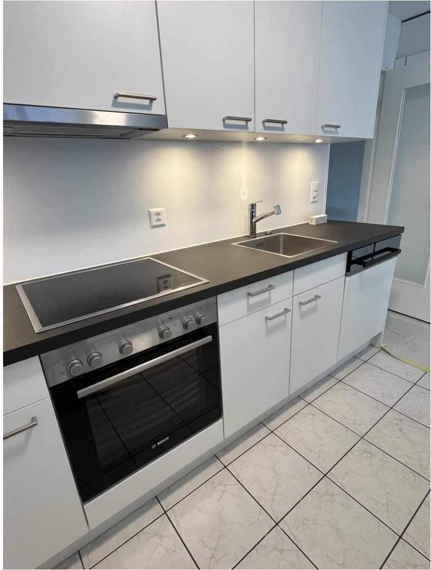
Küchenzeile, komplett erneuert