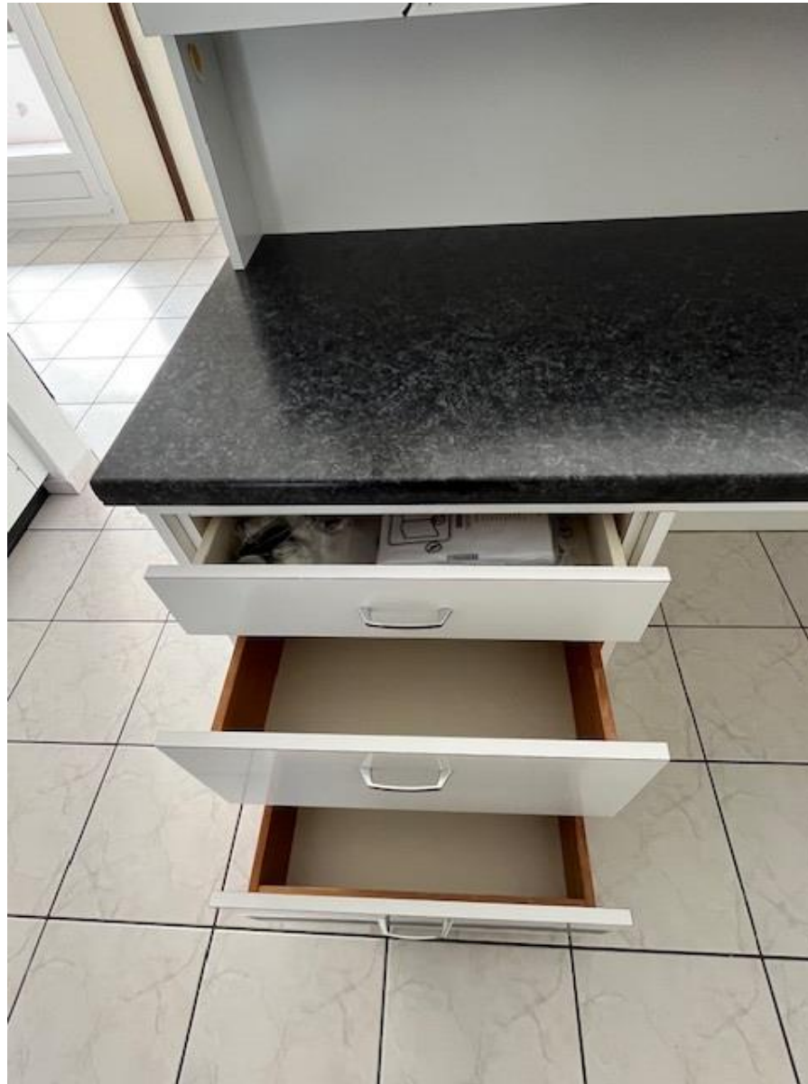
Bar (Küche), hinter Küchenzeile