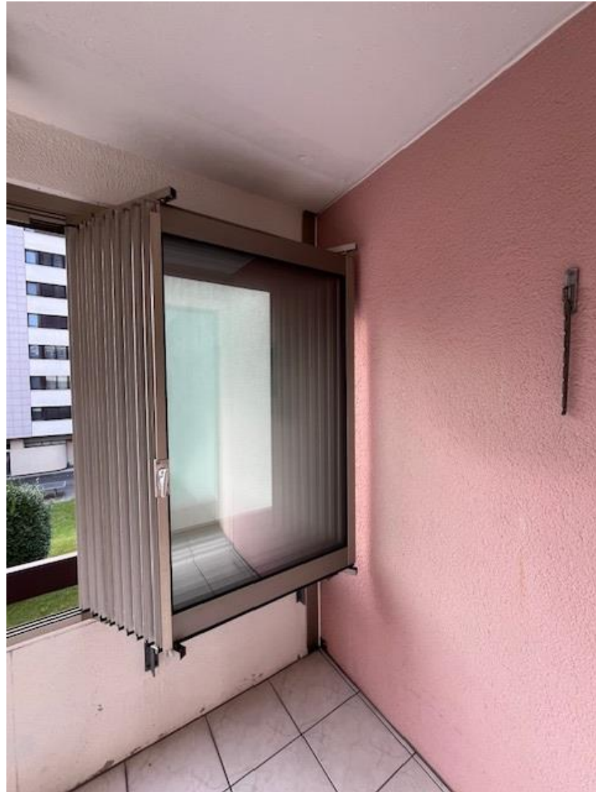
Durchgehende Terrasse mit Schiebeverglasung und Markisen über gesamte Breite