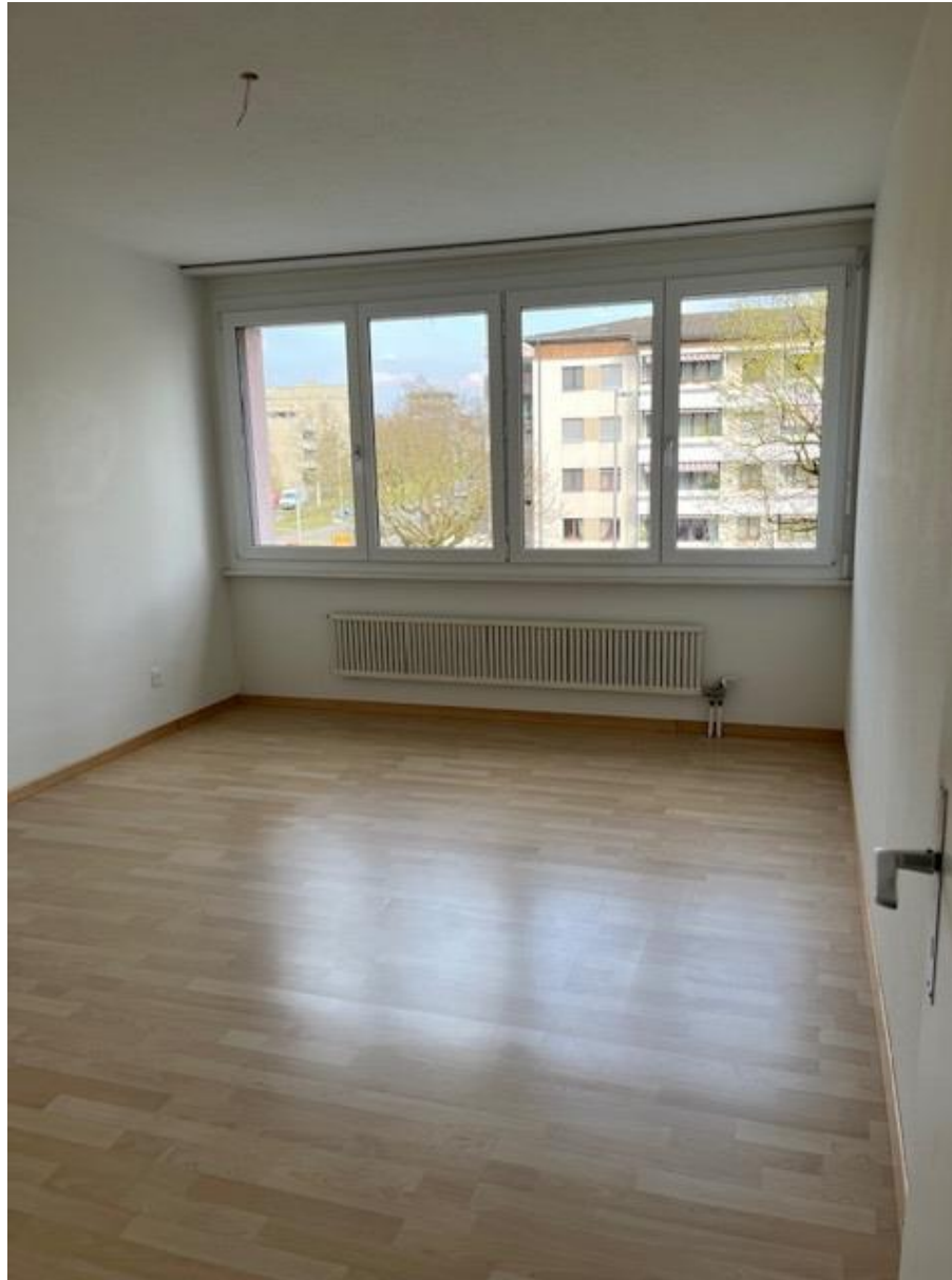
Schlafzimmer 2, 15.3 qm