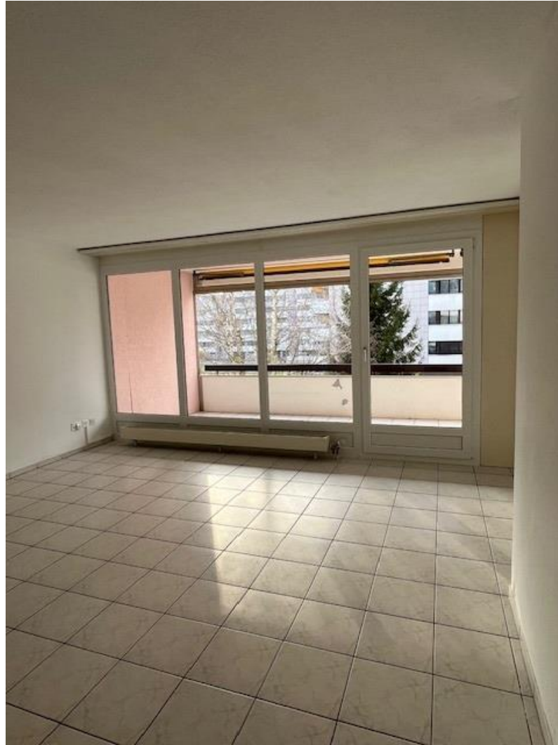
Wohnzimmer /Essbereich, 41 qm