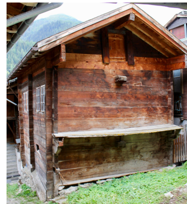
Fassaden Nord-Ost und Nord-West

Kulturdenkmäler Niederwald, Plan Schützenswerte Objekte (2012)