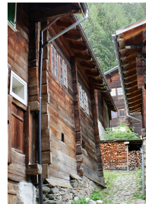
Fassaden Süd-Ost und Nord-Ost