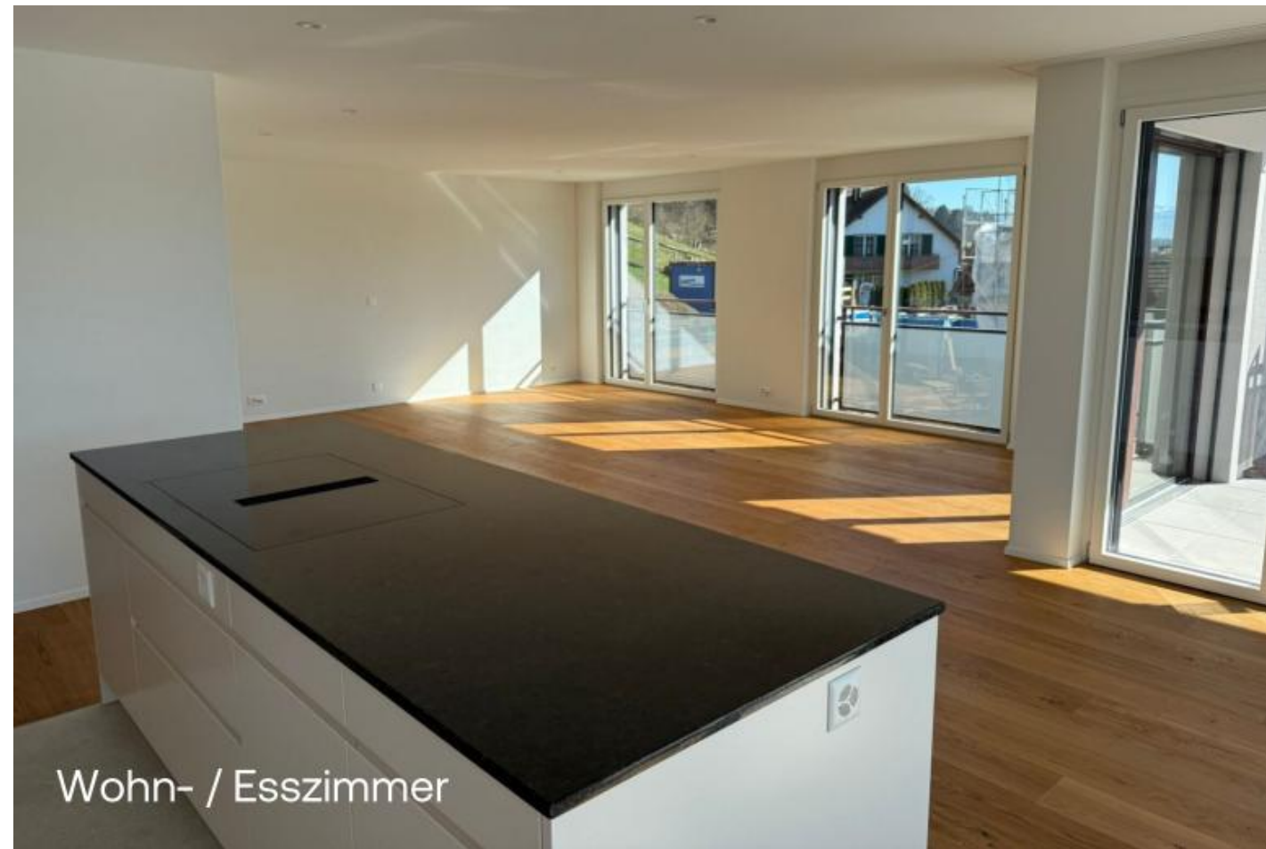
Wohn- / Esszimmer