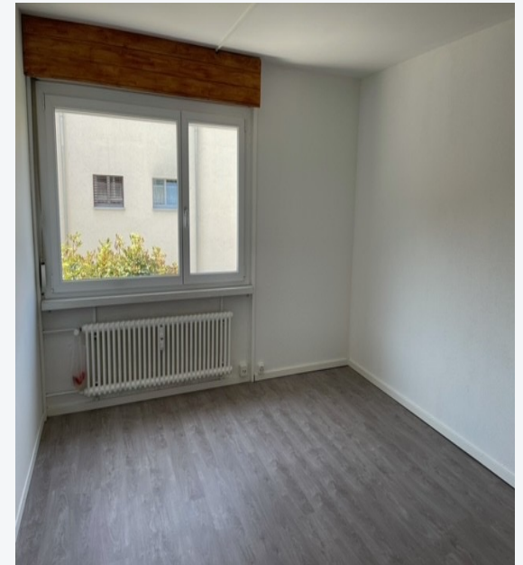
Kinderzimmer 2 · 8.5 m 2

Alle Zimmer frisch renoviert mit neuem Bodenbelag · Helle Räume mit grosszügigen Fenstern