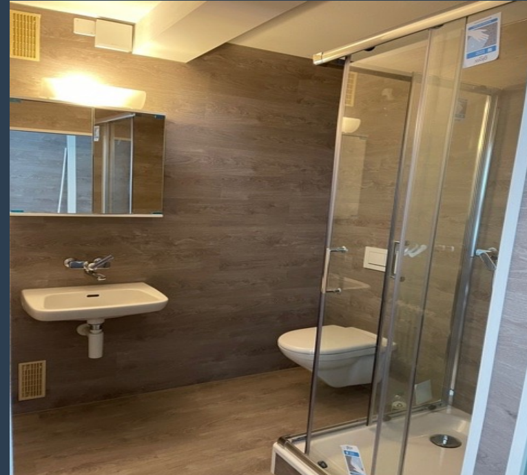
Dusche / WC / Lavabo