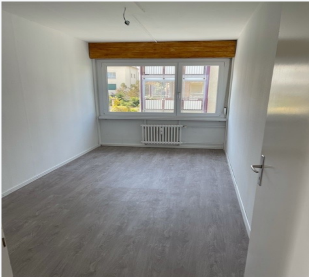
Elternschlafzimmer · 15.2 m 2