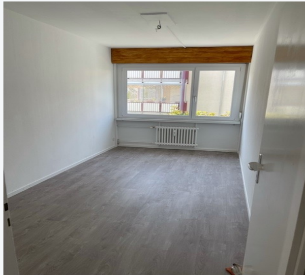
Kinderzimmer 1 · 10.2 m 2