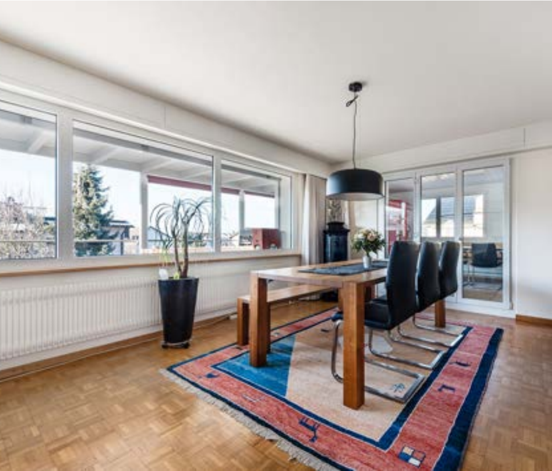
offener Essbereich mit Kacheltragofen