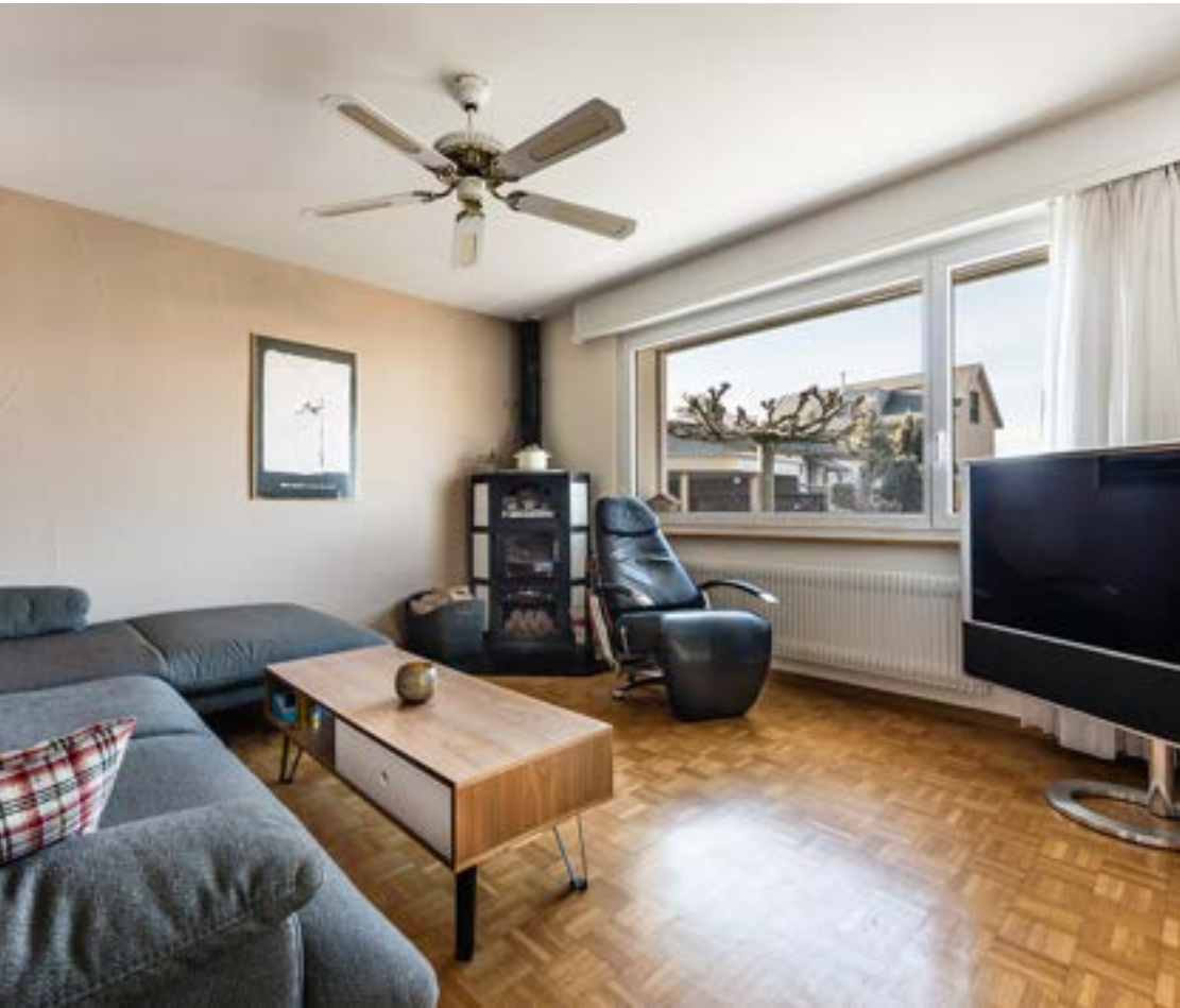
Wohnbereich mit Schwedenofen