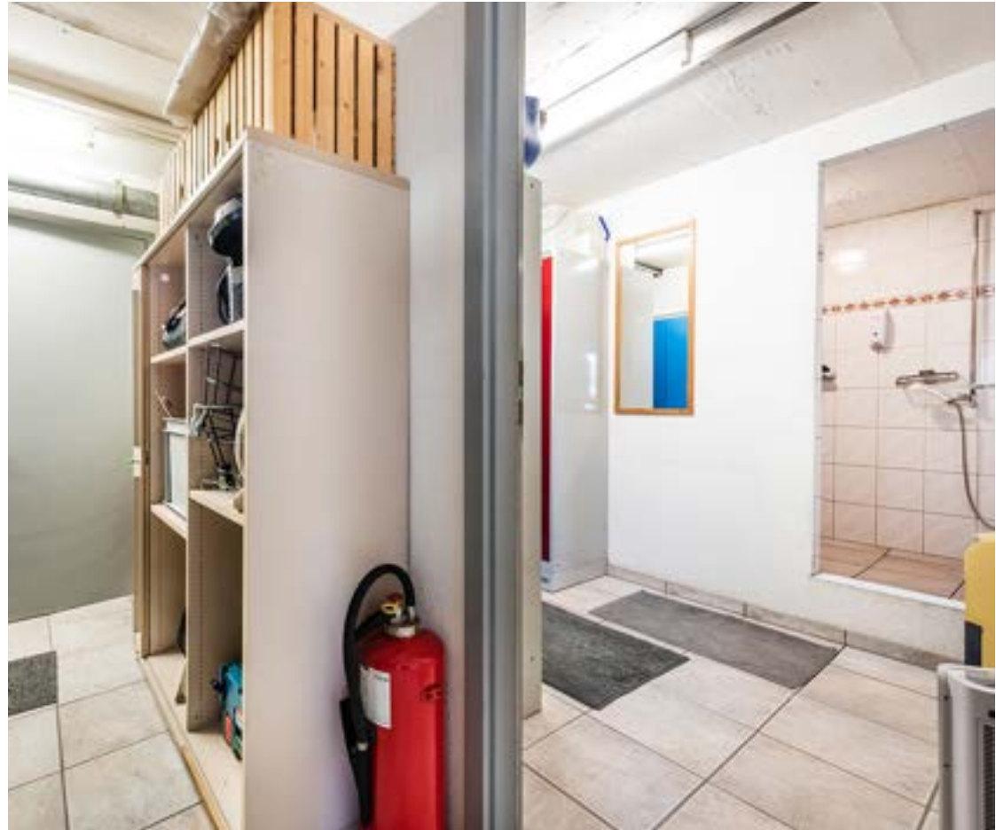
Garderobe / Duschen (umgenutzte Garagenbox)