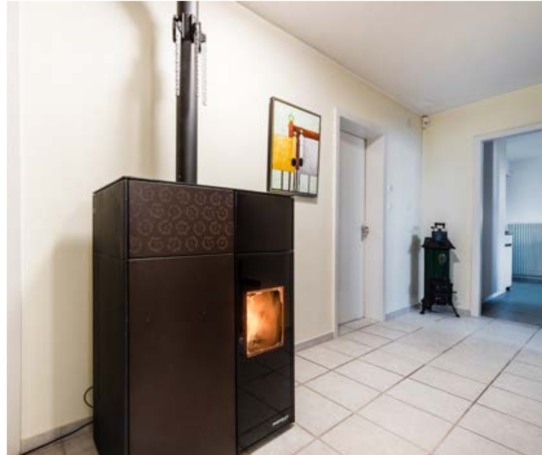
Korridor mit Pelletofen