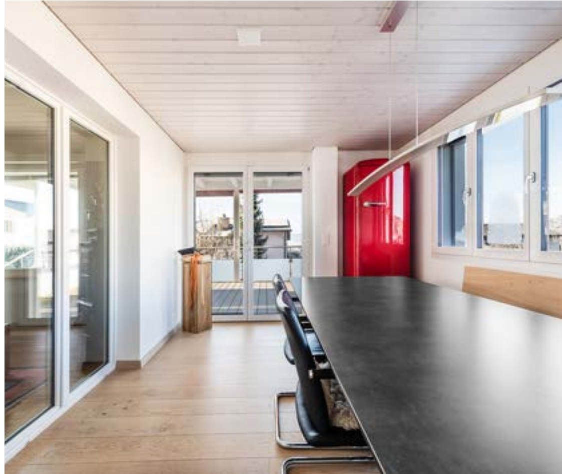
Essbereich mit Wintergartencharakter