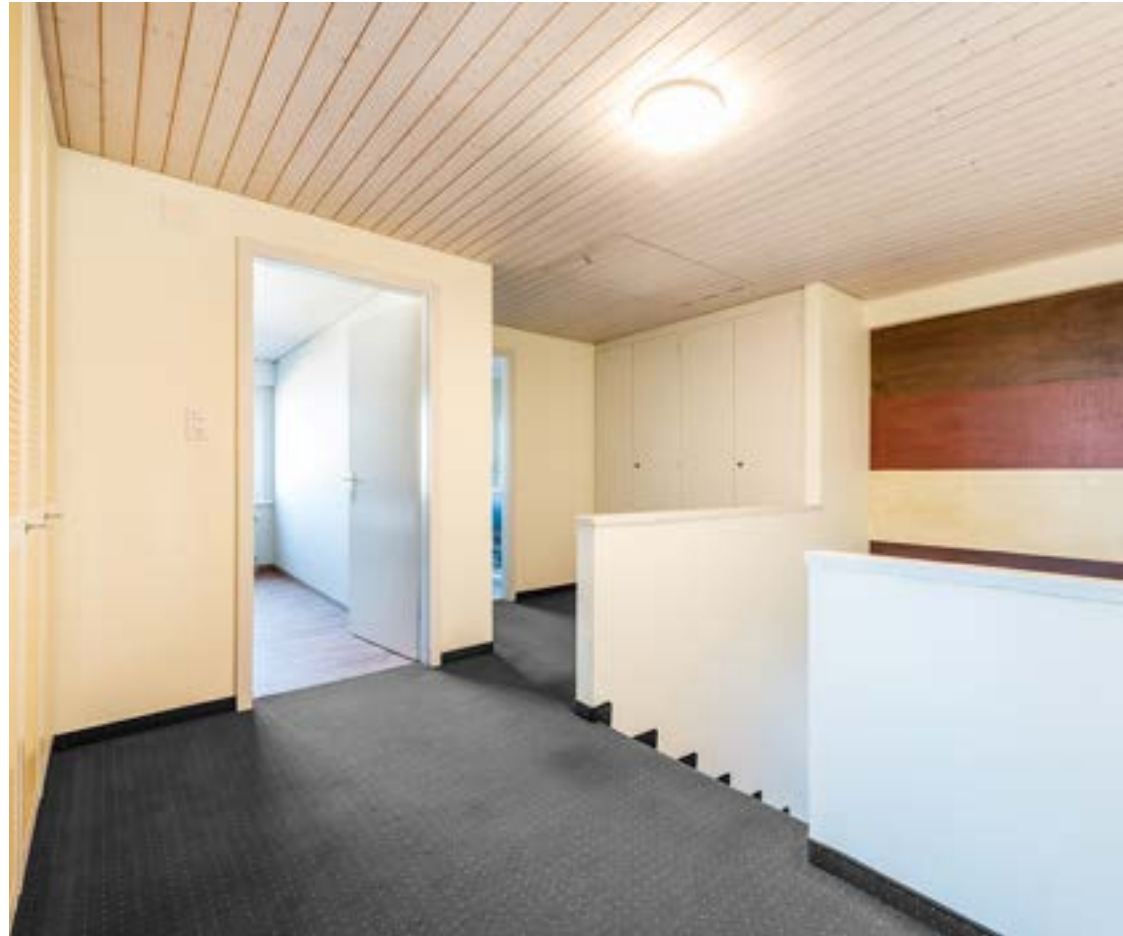
Treppenaufgang / Korridor