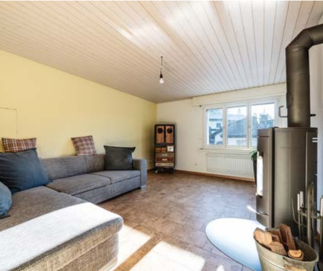
Zimmer 1 mit Schvedenofen