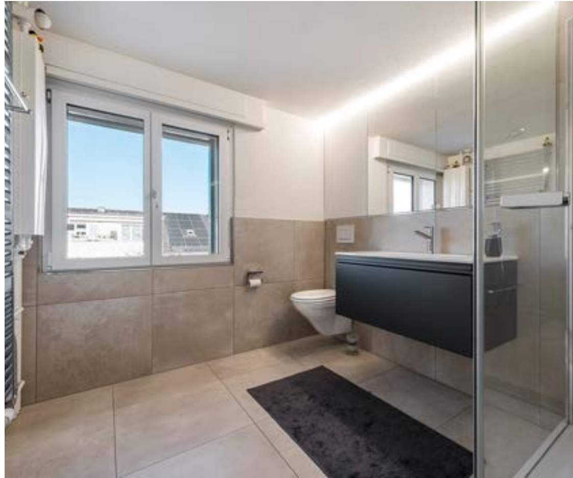
Dusche / WC