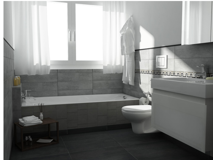
Bild ist nicht von der Wohnung / Zeigt Ausbaustandard

Nasszellen verfügen über Lavabos mit Unterbau, Badewanne bzw. Regendusche, sowie beleuchtete Spiegelschränke.