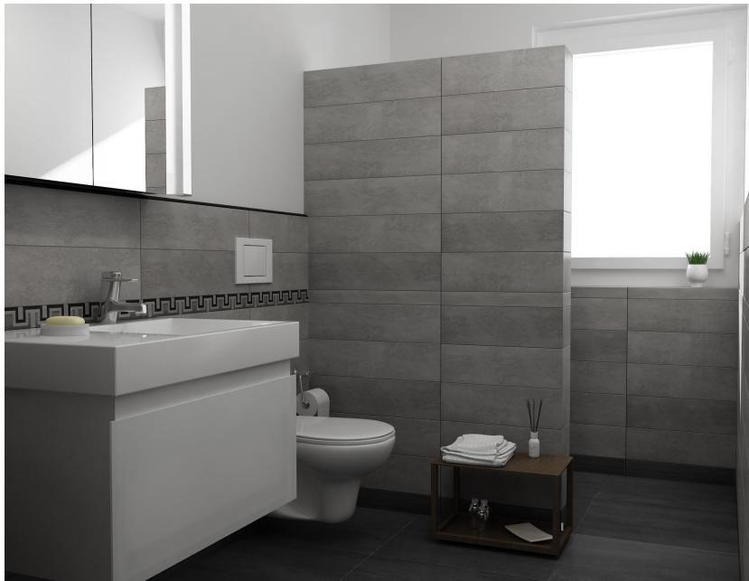
Bild ist nicht von der Wohnung / Zeigt Ausbaustandard