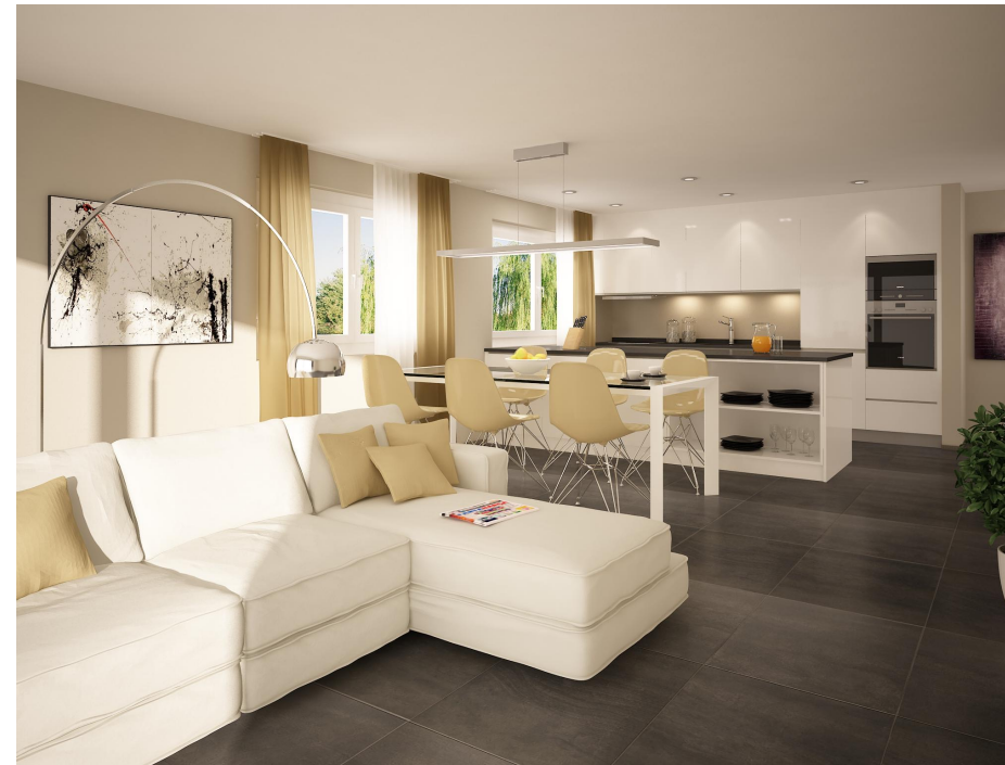
Bild ist nicht von der Wohnung / Zeigt Ausbaustandard