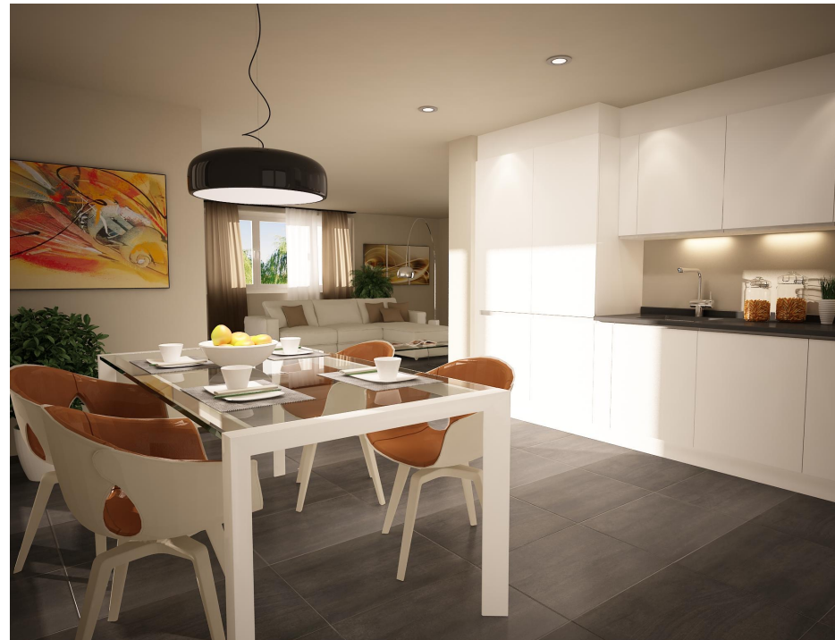
Bild ist nicht von der Wohnung / Zeigt Ausbaustandard