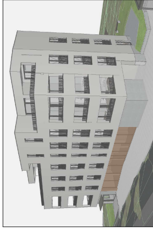
VISUALISIERUNG FASSADE SÜD-OST

BNF: 80.25m 2 RAUMHÖHE: 3.29m RAUMHÖHE ABST. RAUM: 1.37m