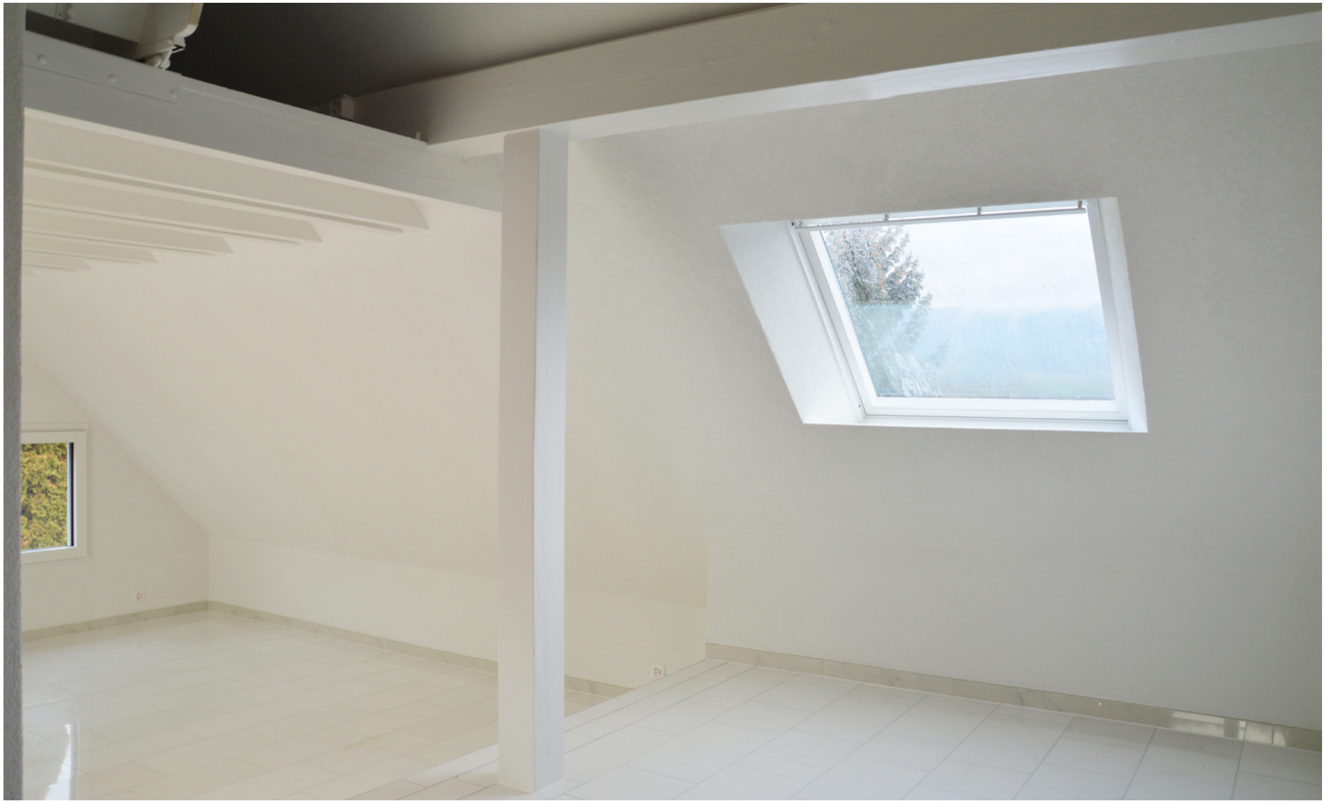
Essbereich mit Dachfenster