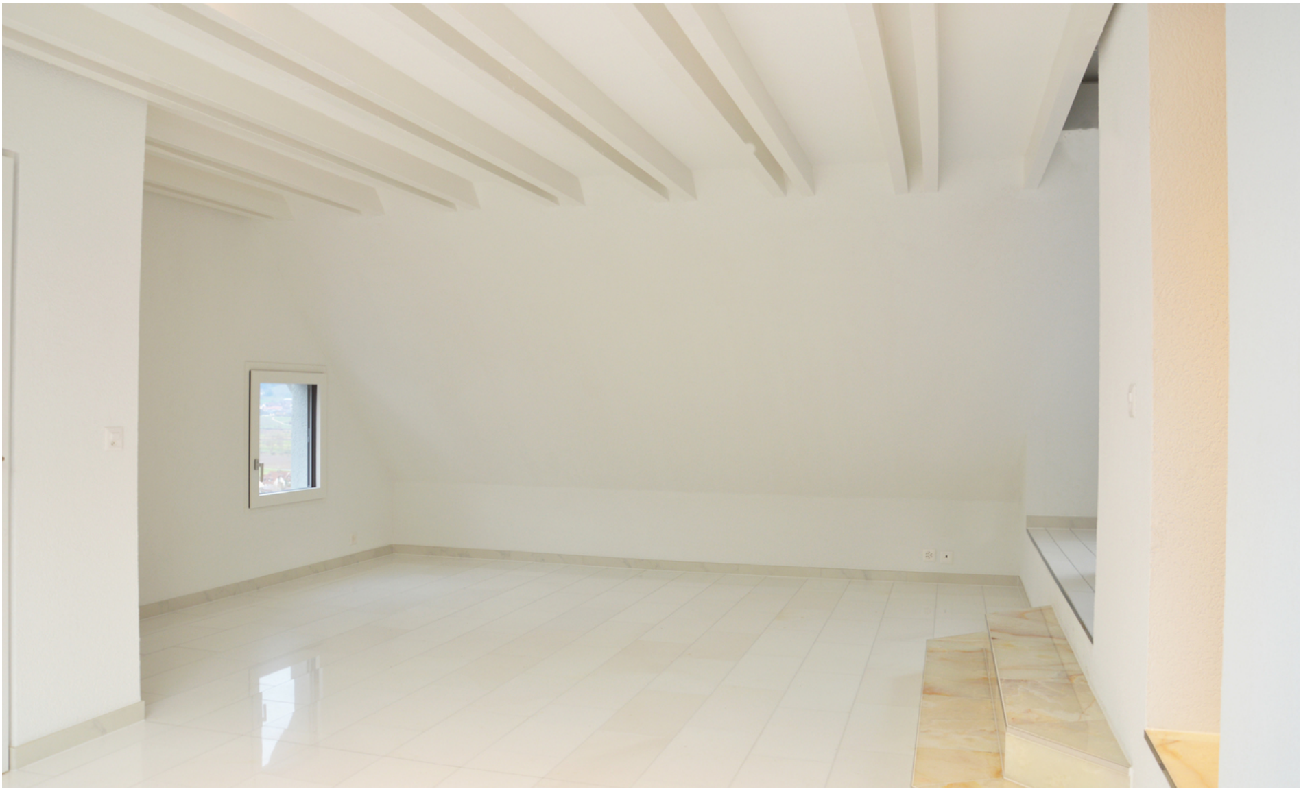
Wohnbereich mit elegantem Marmorboden