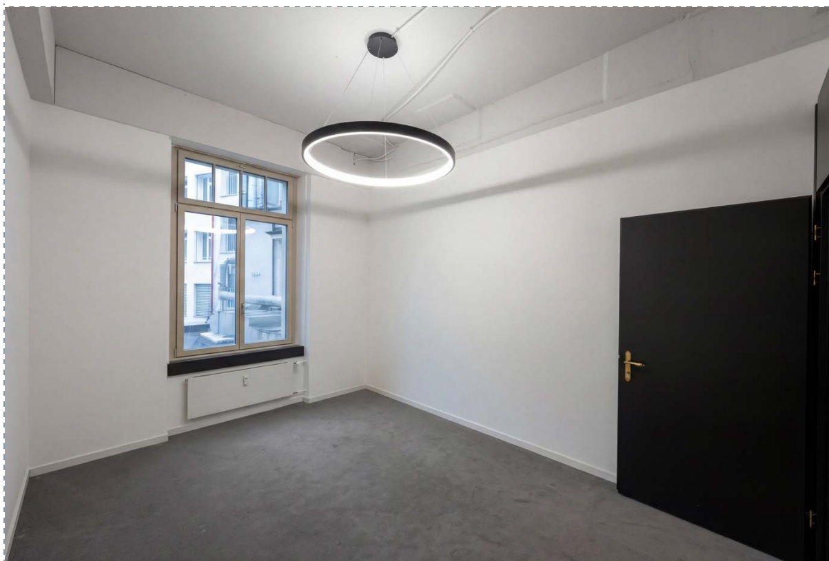
Innenansicht – Pausenraum