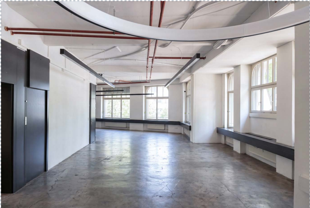
Innenansicht – Hauptraum Richtung Ost