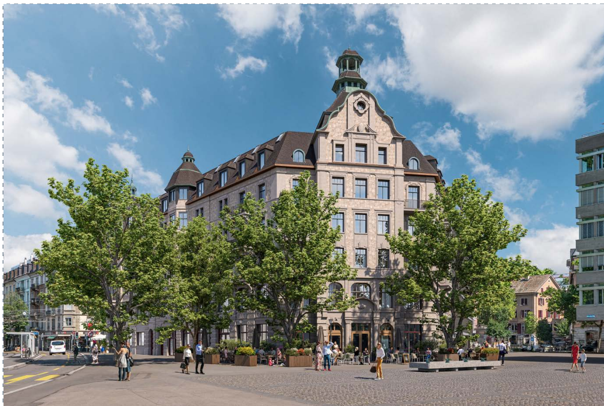
Aussenansicht / Umgebung