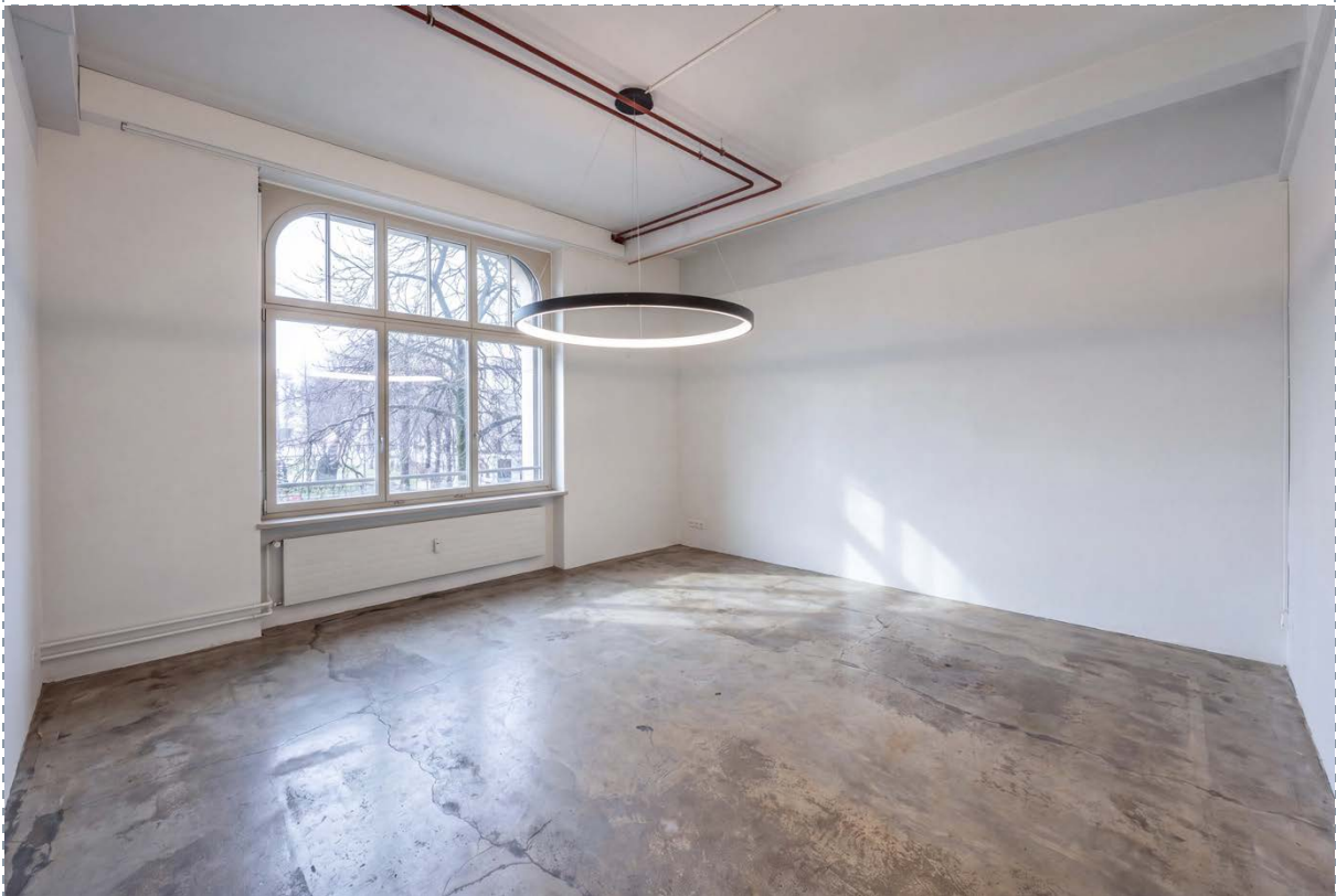
Innenansicht – Sitzungszimmer