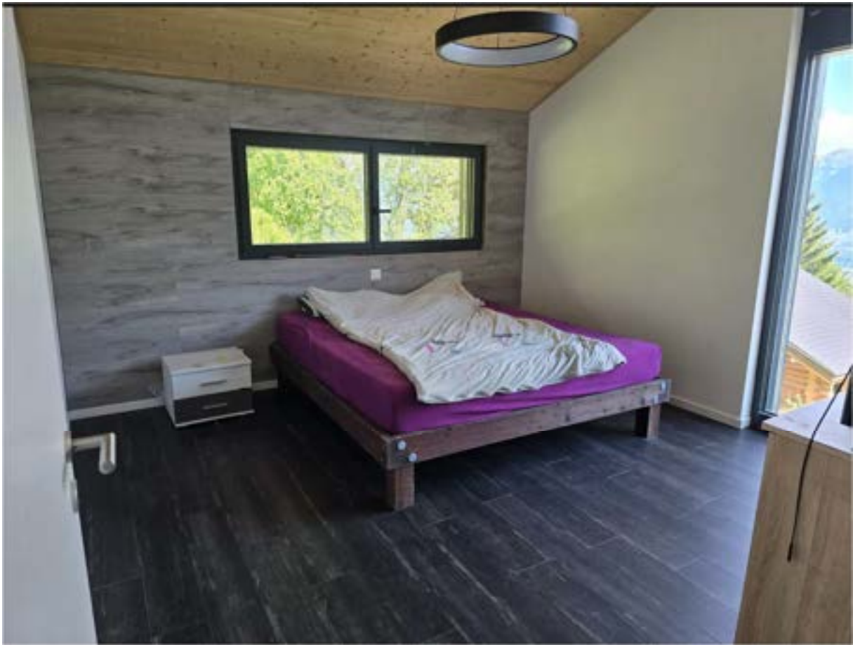
Chambre 3 (dressing)