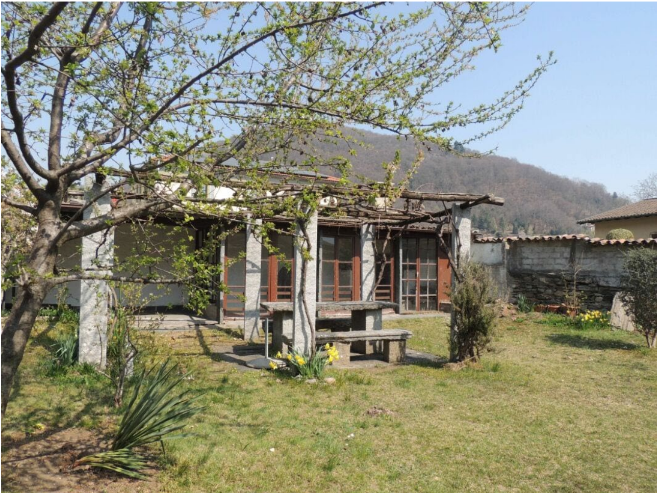
Fotografie 3.5 (Piano 1)