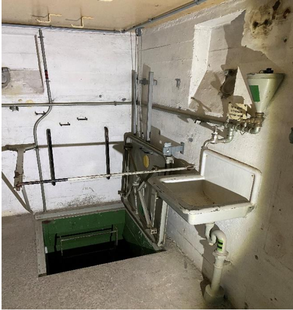
EG Nordostecke: Deckel zur Leiter ins UG offen Handwaschbecken HG-Auswurf verschlossen