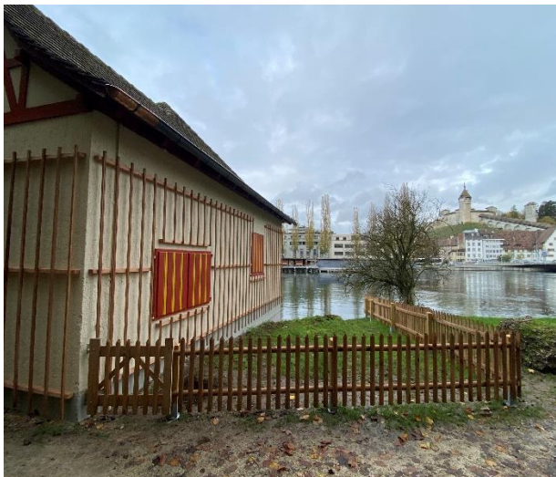
Ostseite mit Garten. Scharte des Mg Ost In der Fassadenmitte ein blinder Tarnladen