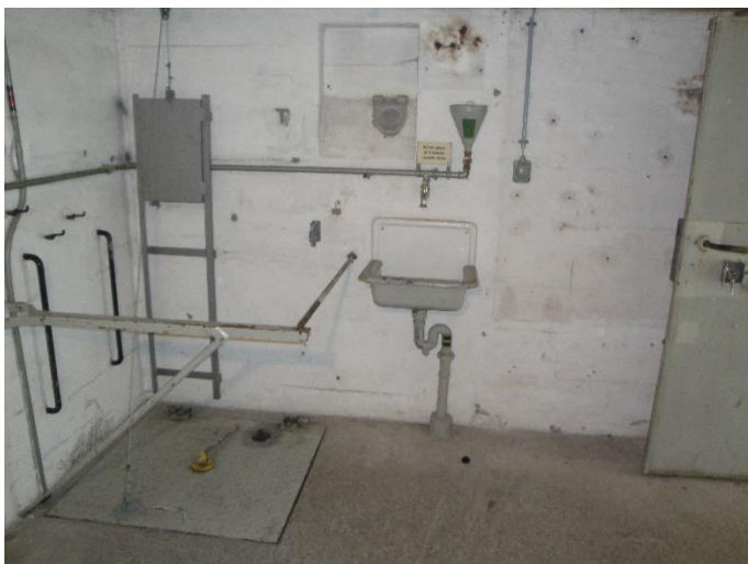
EG Ostwand: Deckel zum UG mit Gegengewicht geschlossen Handwaschbecken Hg-Auswurf Schutzgeländer um Abstieg Panzertüre