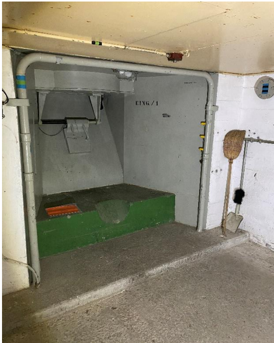
EG Nordwestecke: Mg-Stand West Mit Leitung des Kollektivmaskenschutzes