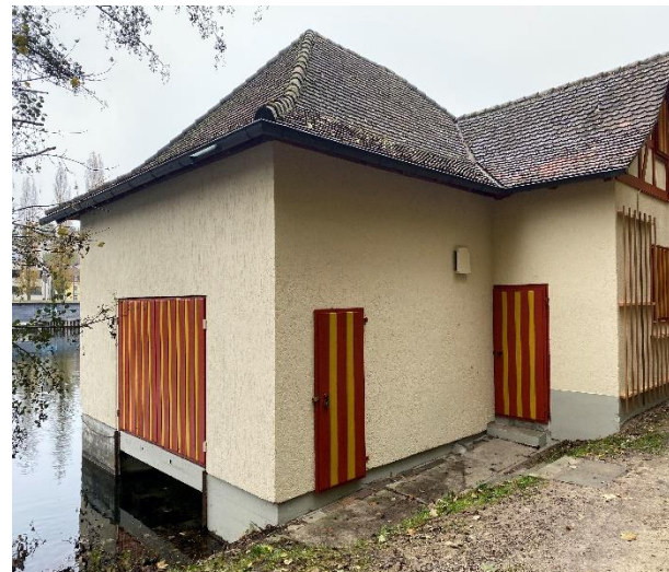
Westseite: Materialraum mit Doppeltor separater Zugang