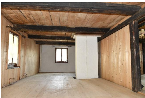
Zimmer OG, nordseitig, Hangeseite