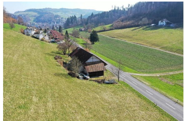
Westansicht in Richtung Dorf Unterkulm