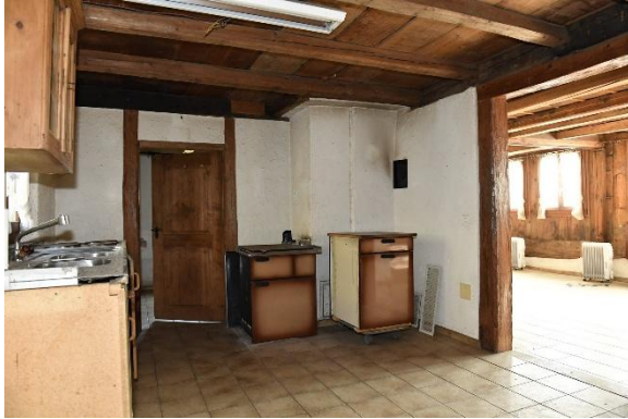
Küche mit Tiba-Holzherd und Wasserspeicher für Bodenheizung

Aufgrund der länger zurückliegenden Sanierung besteht Erneuerungsbedarf.