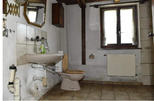
Bad mit (BW, WC, LA)