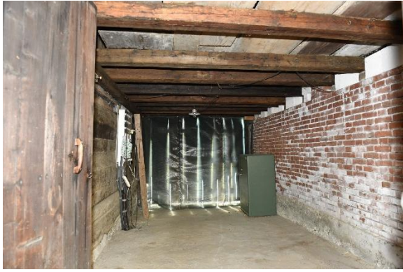
Tenn angrenzend an Wohnteil