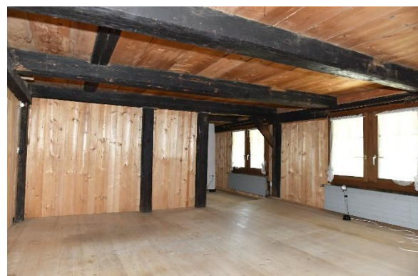
Zimmer OG, südseitig, Strassenseite