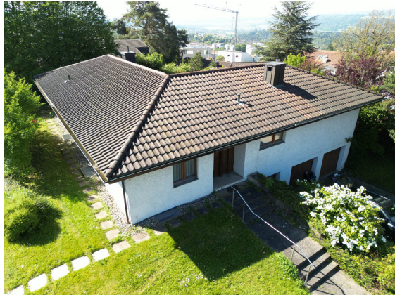
Abbildung 2: Nordansicht