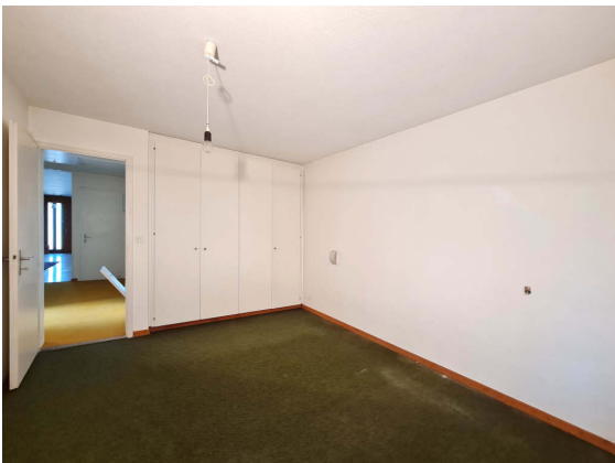
Abbildung 7: Eltern