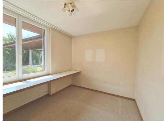
Abbildung 6: Kind 2