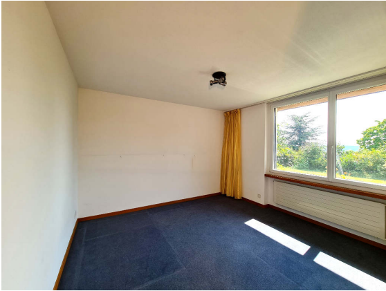
Abbildung 5: Kind 1