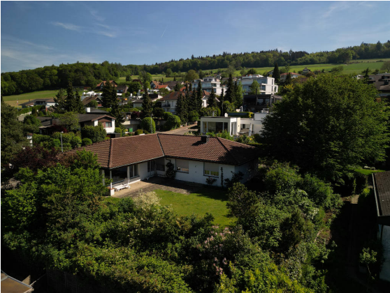
Abbildung 1: Südansicht