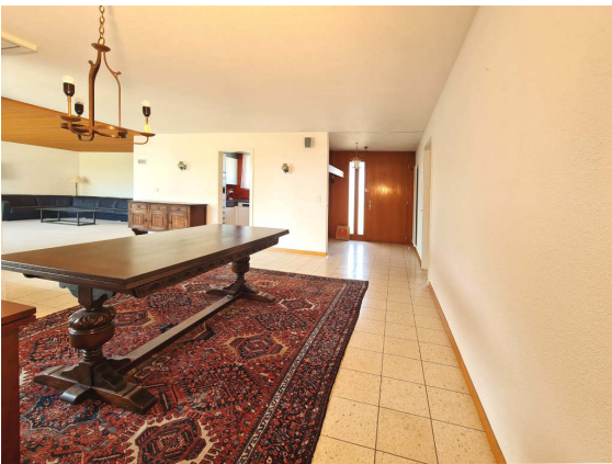
Abbildung 3: Wohnen