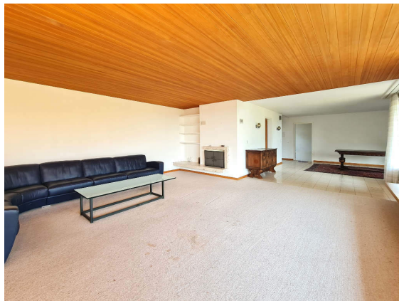
Abbildung 4: Wohnzimmer