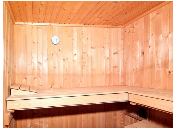
Abbildung 8: Sauna