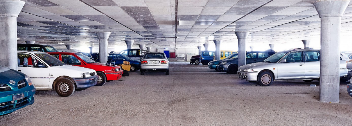
Ansicht Zufahrten von Buchenhagstrasse