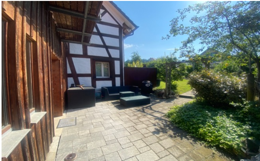
Sitzplatz hinter Haus