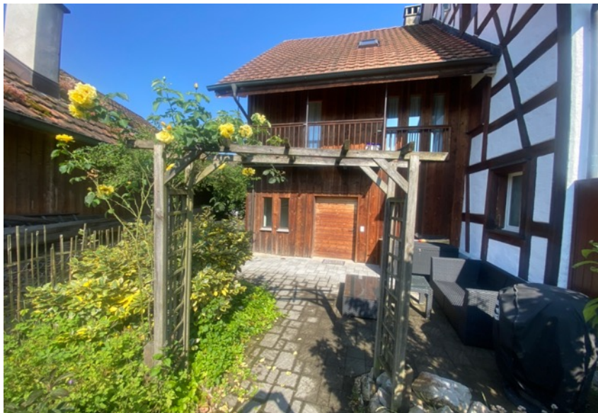
Sicht auf Haus von hinten