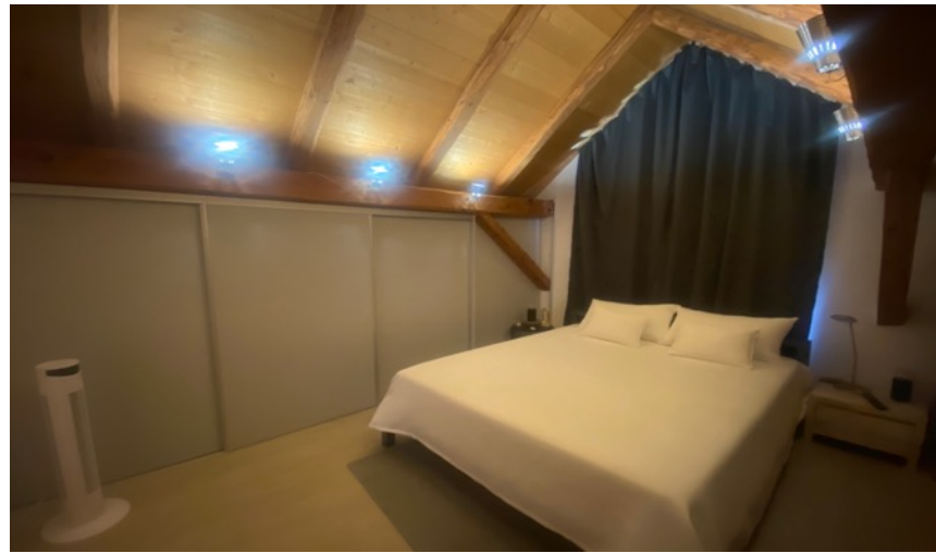
Schlafzimmer im Dachstock mit grossem Einbauschrack