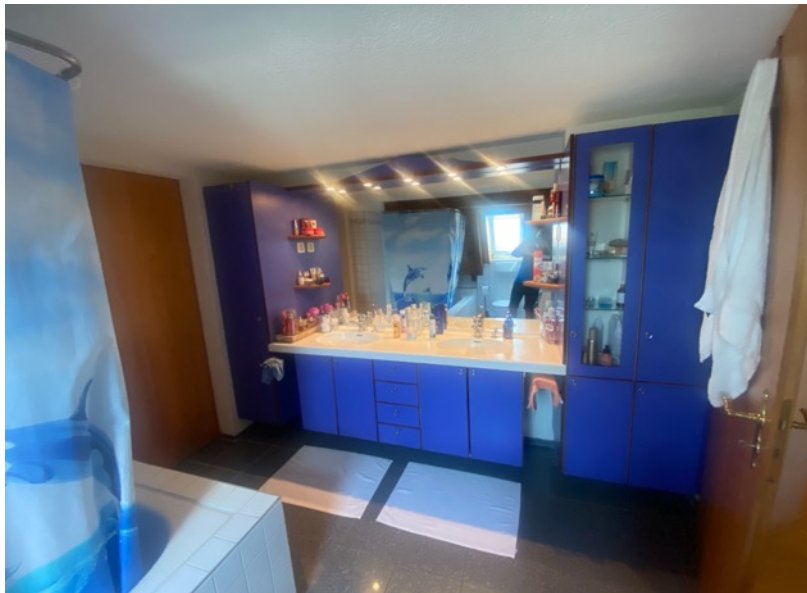
Bad im Dachstock