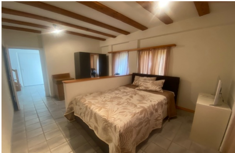
Schlafzimmer im EG