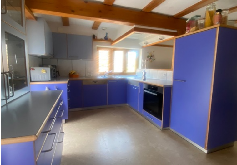
Küche im 1. Stock