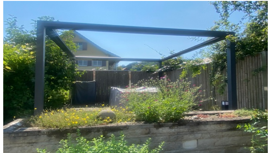
Gemeinsamer Sitzplatz mit elektrischer Pergola