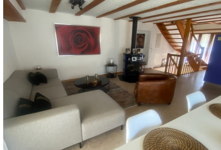
Wohnzimmer mit Schvedenofen