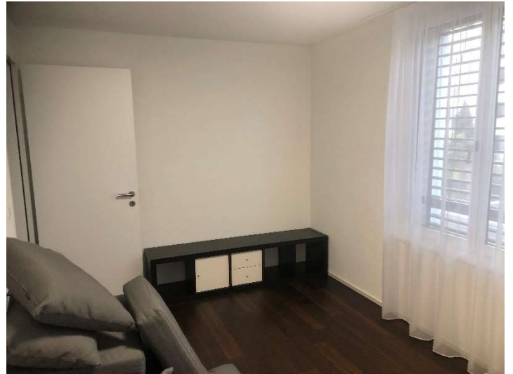
Zimmer 3: 13m 2 / Zimmer 4: 13 m 2