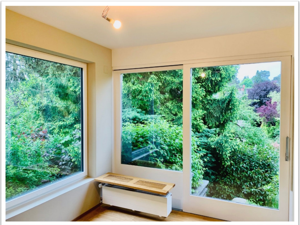
Gartenzimmer mit direktem Zugang zum Garten