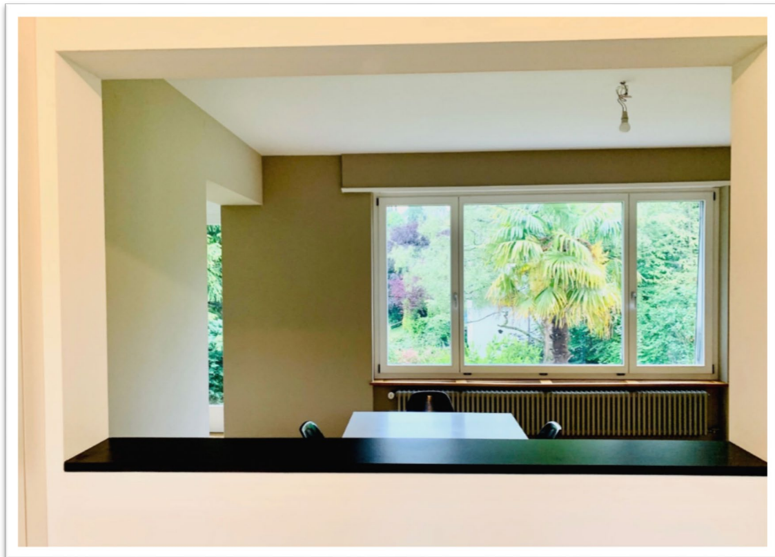
Durchreiche von Küche ins Ess- /Wohnzimmer