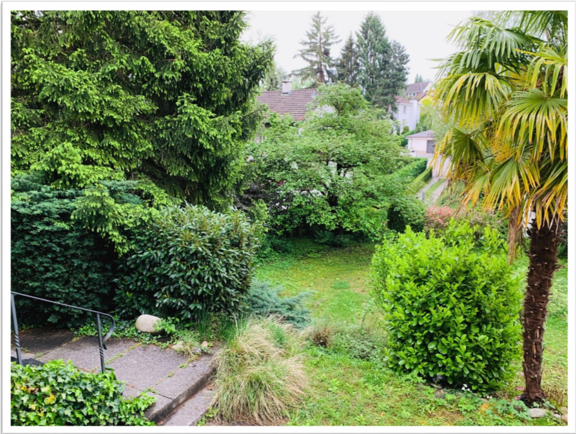
Sicht vom Ess- /Wohnzimmer in den schönen Garten mit teilweise altem Baumbestand

Der grosszügige Garten mit verschiedenen Niveaus besteht teilweise aus altem, wunderschönem Baumbestand und verfügt auch über eine grosszügige Rasenfläche.