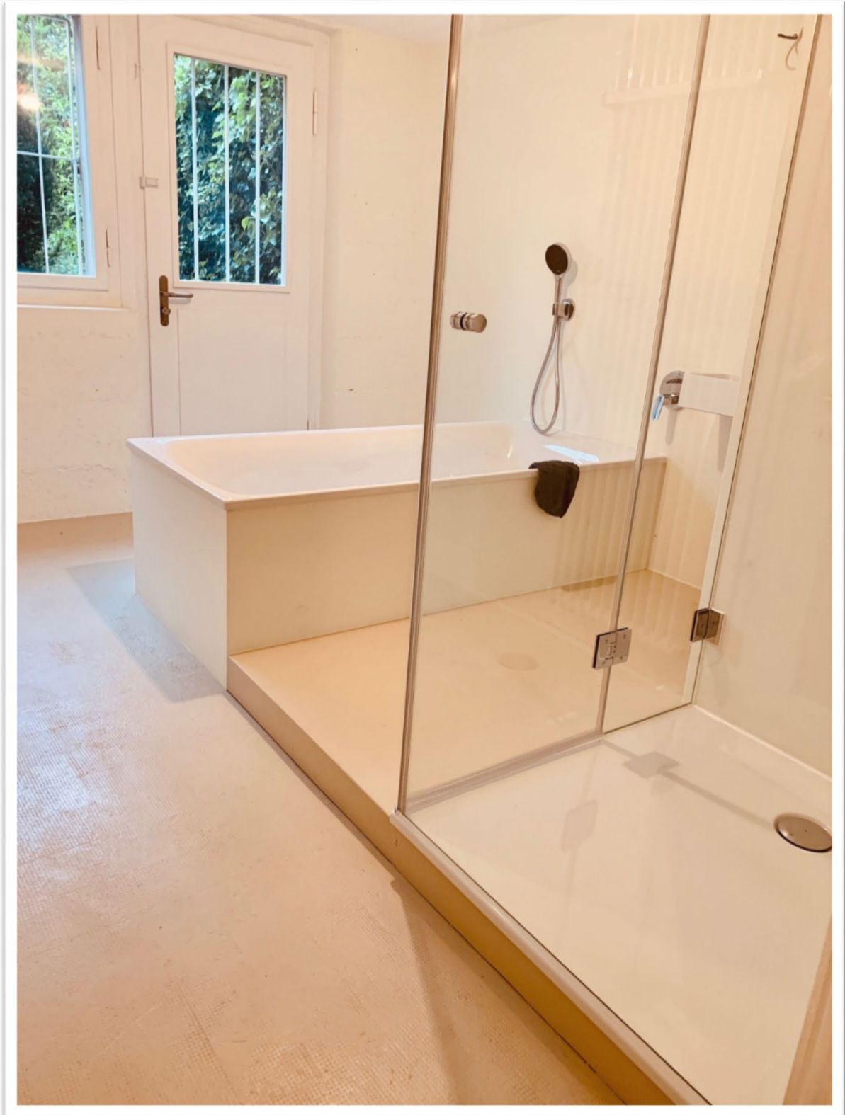
Badestube im UG mit direktem Zugang in den grosszügigen Garten