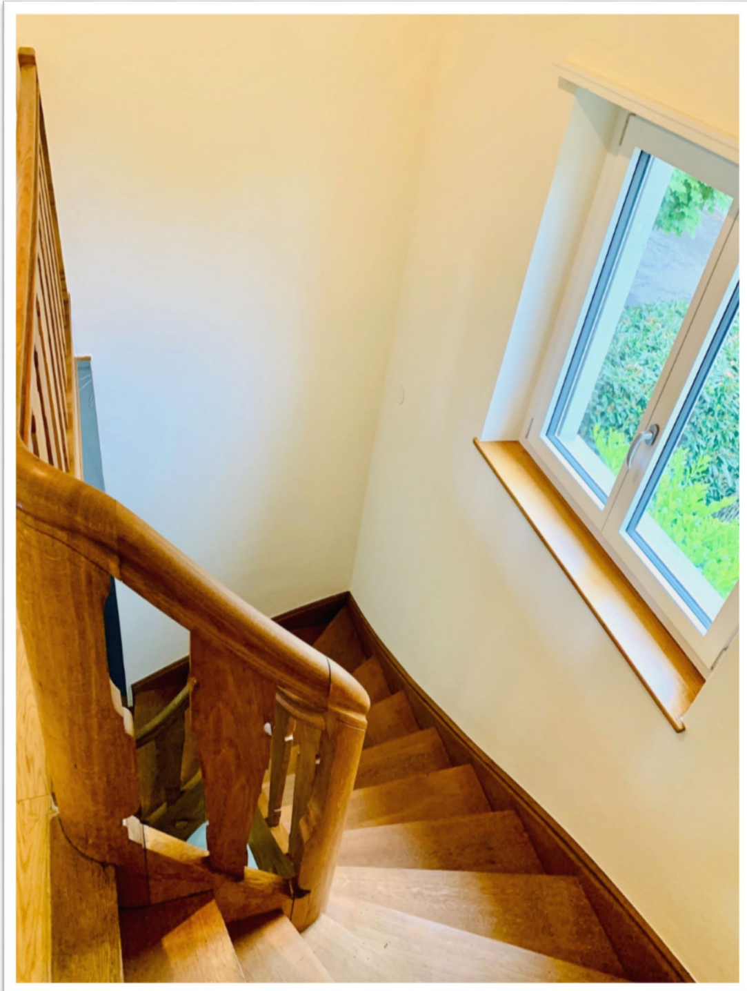
Wendeltreppe vom 1. OG ins EG