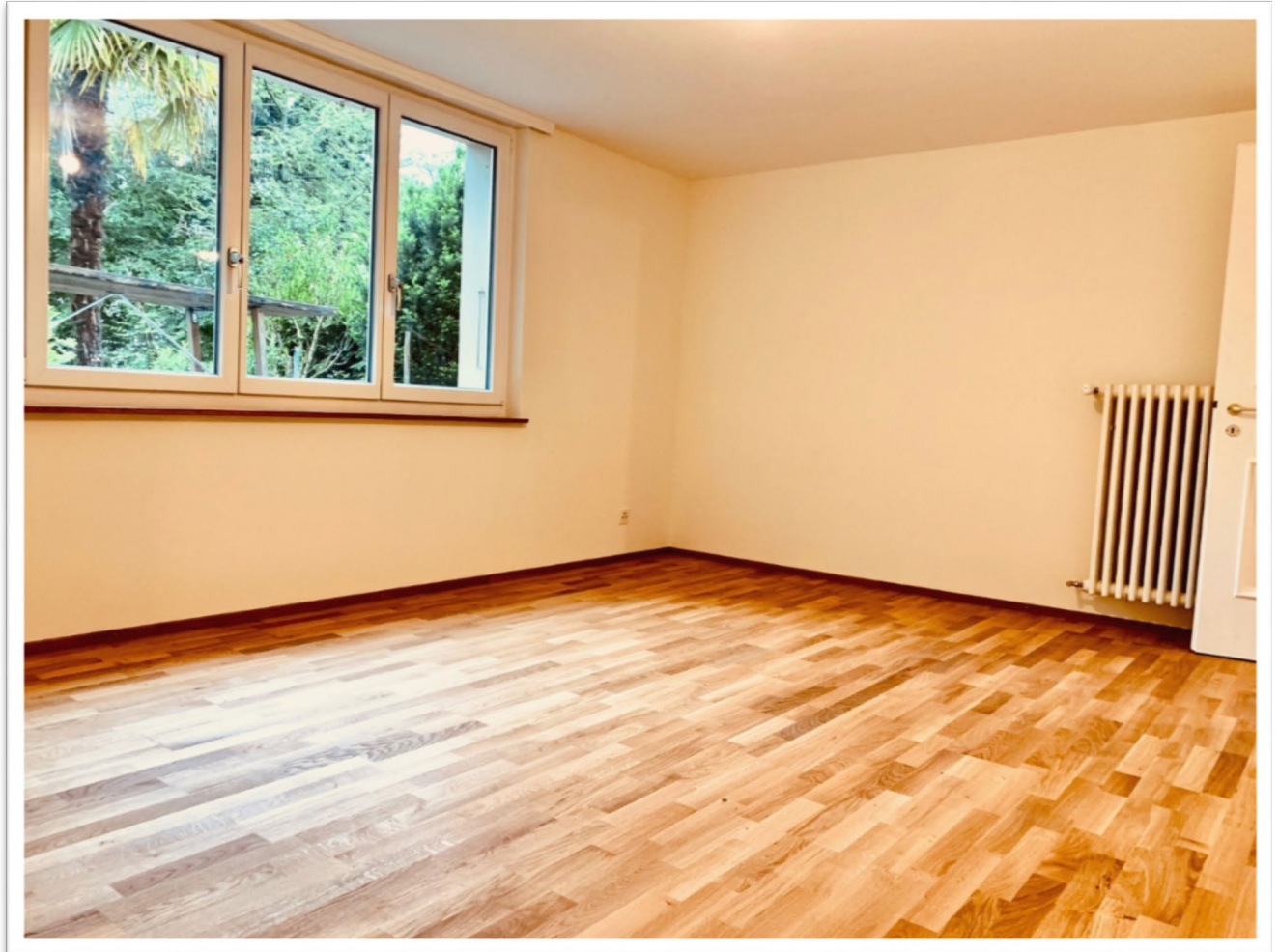
Helles Zimmer/ Büro/ Hobbyraum/Studio im UG

Das untere Stockwerk welches über einen grossen Raum (19m 2 ), eine Badestube (11.2) mit direktem Zugang in den Garten (und über einen Gartenweg direkt auf die Strasse) und eine Waschküche (8.5 M 2 ) verfügt, kann sehr gut auch als Physiotherapie oder ähnlichem Studio genutzt werden.