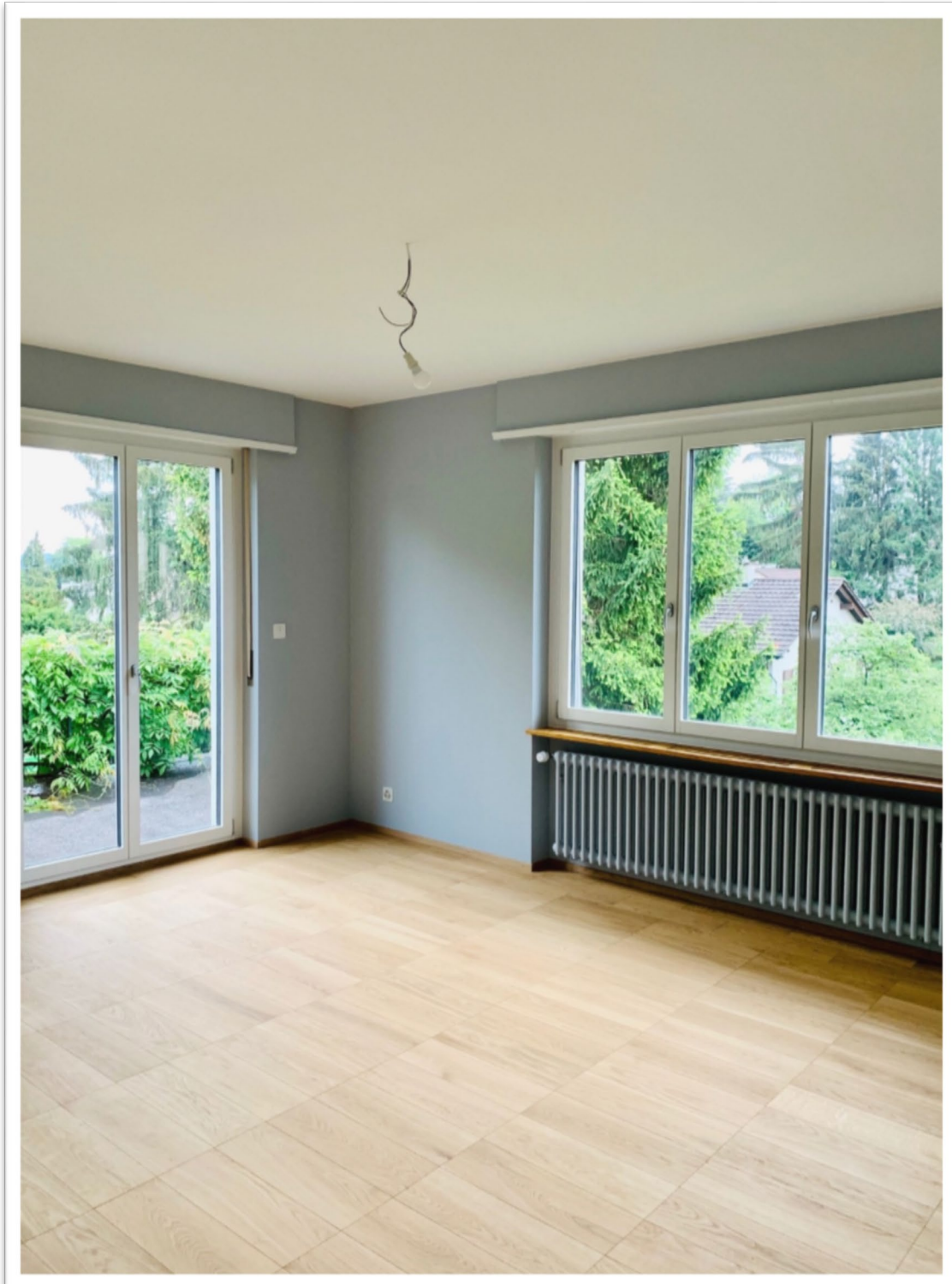
Blaues Zimmer im 1. OG mit Zugang auf die grosse, sonnige Terrasse

Das 1. Obergeschoss verfügt über drei Zimmer à 19.8 m 2 , 15 m 2 und 9.7 m 2 und ein Badezimmer. Das Südost-Zimmer bietet zudem Zugang zur grosszügigen Terrasse (ca. 14 m 2 )