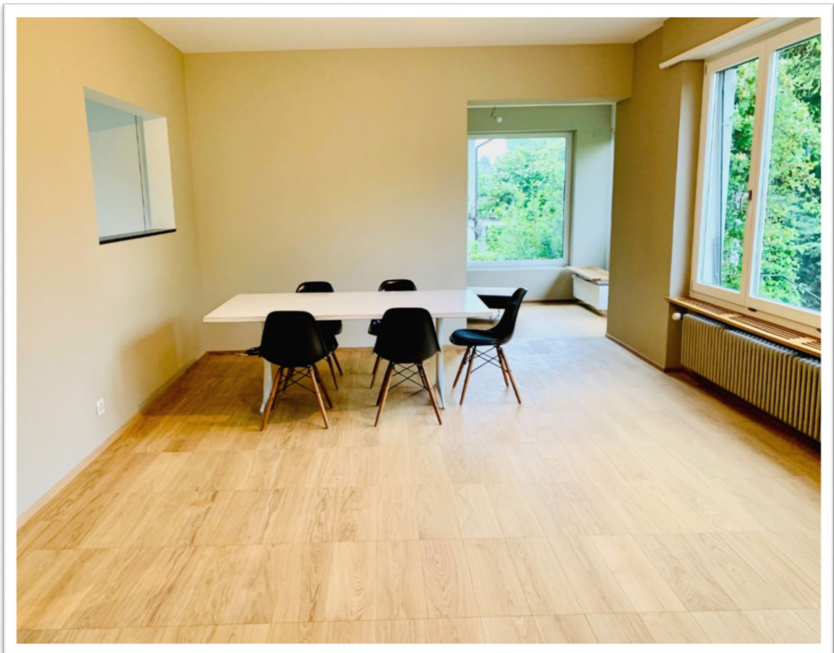
Ess- /Wohnzimmer mit Fensterfront und zum Gartenzimmer