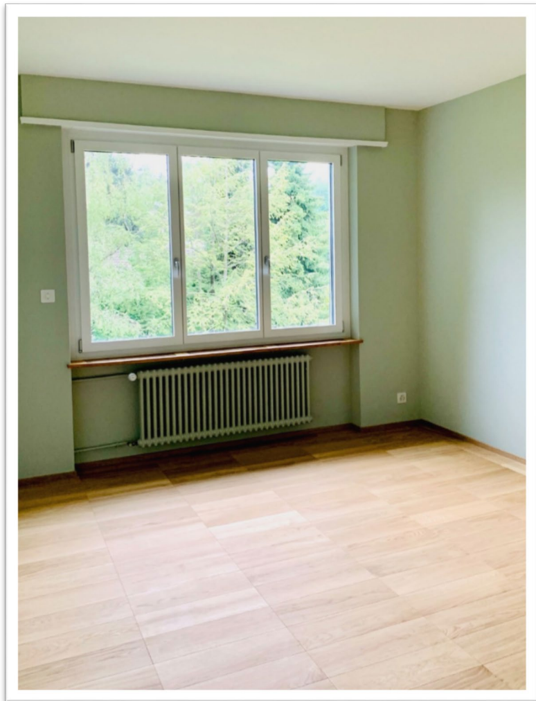
Beiges und grünes Zimmer im 1. OG