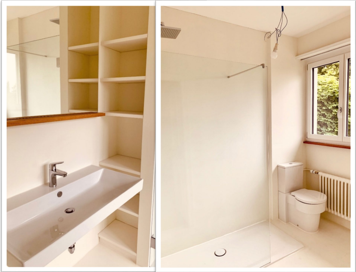
Helles, in Weisstönen gehaltenes Badezimmer mit grosser Dusche im 1. OG

Durch eine Auszugstreppe gelangt man ins geräumige Dachgeschoss mit beheiztem Zimmer (ca. 11 m 2 ) mit grossem Fenster. Die restliche Fläche dient als Estrich.