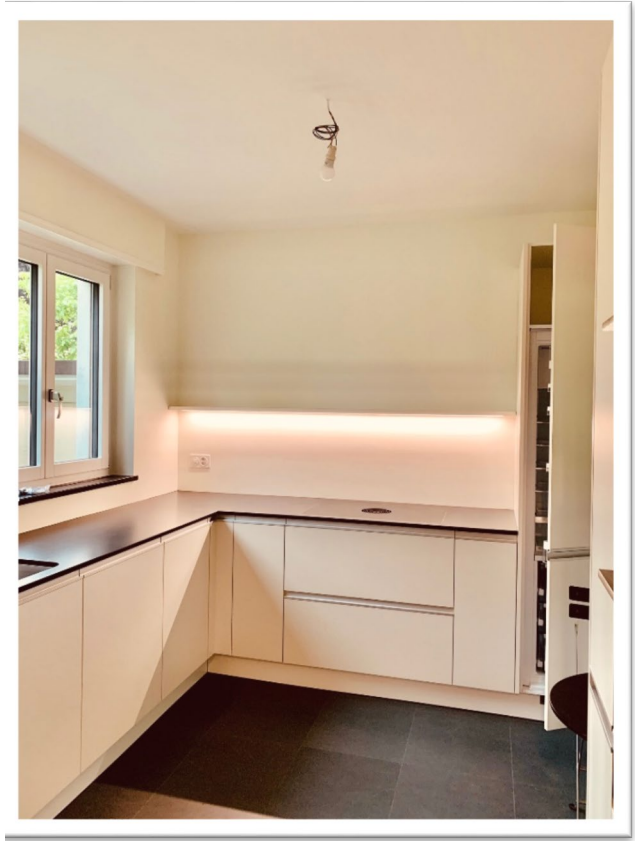
Moderne, schlichte Küche