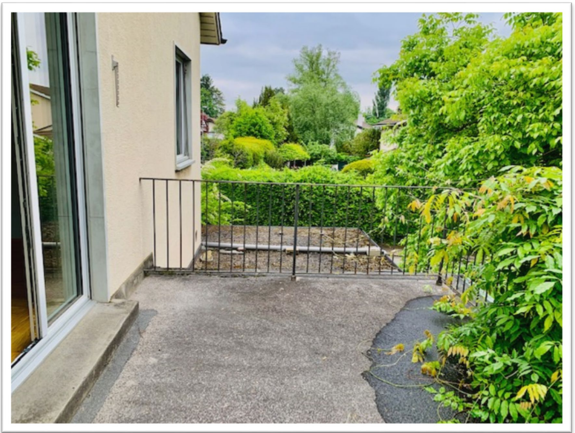
Schöne grüne Terrasse 1. OG, einmal zum Garten, einmal zur Strasse