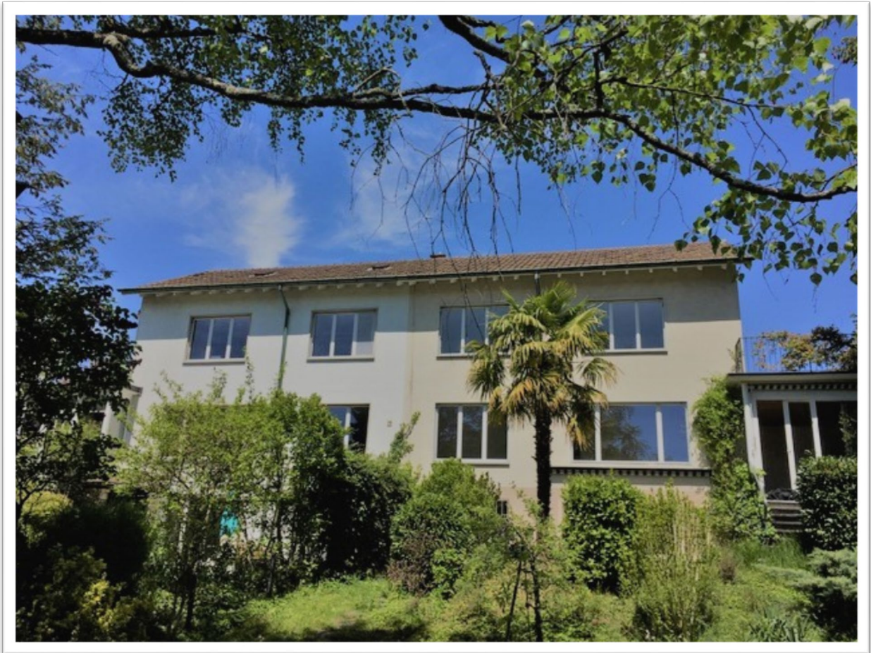
Gartenansicht, Südlage (Haus rechts)

Unser 7 Zimmer Doppel Einfamilienhaus besticht durch seine klare Architektur der 50er Jahre. Alle Zimmer des gegen Süden ausgerichteten dreistöckigen Hauses sind lichtdurchflutet und die grosszügigen Fensterfronten erlauben durchwegs grosszügige Aussichten in die grüne Umgebung und Region.