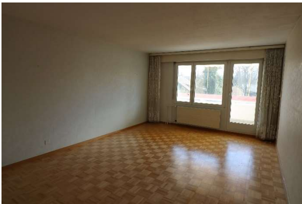
Wohnzimmer nach Südosten ausgerichtet