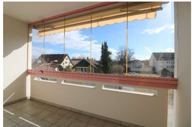
Verglaster Balkon, Blick in Richtung Südosten