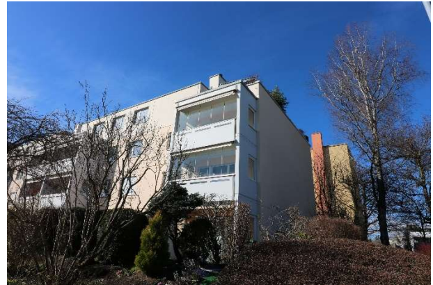
Mehrfamilienhaus Nr. 4, Südostansicht