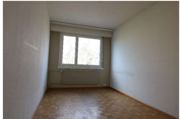
Schlafzimmer nach Nordwesten ausgerichtet