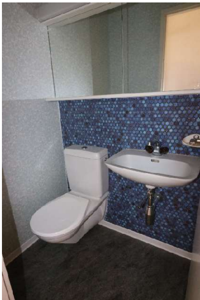
Nasszelle 2 (WC/Lavabo)