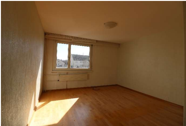
Schlafzimmer nach Südosten ausgerichtet