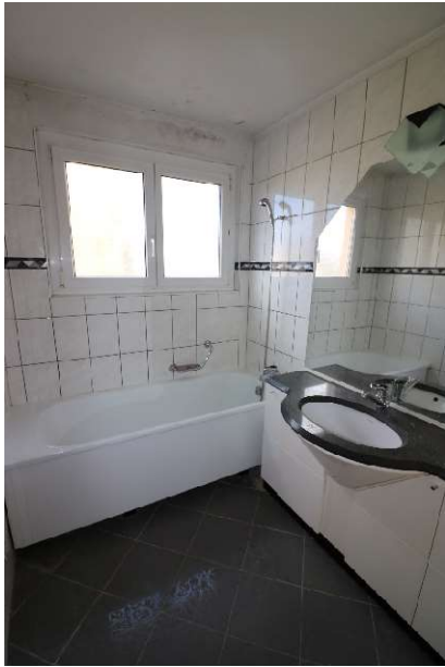
Nasszelle 1 (Badewanne/Lavabo)