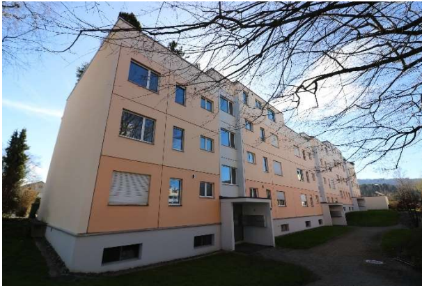
Mehrfamilienhaus Nr. 4, Nordwestansicht