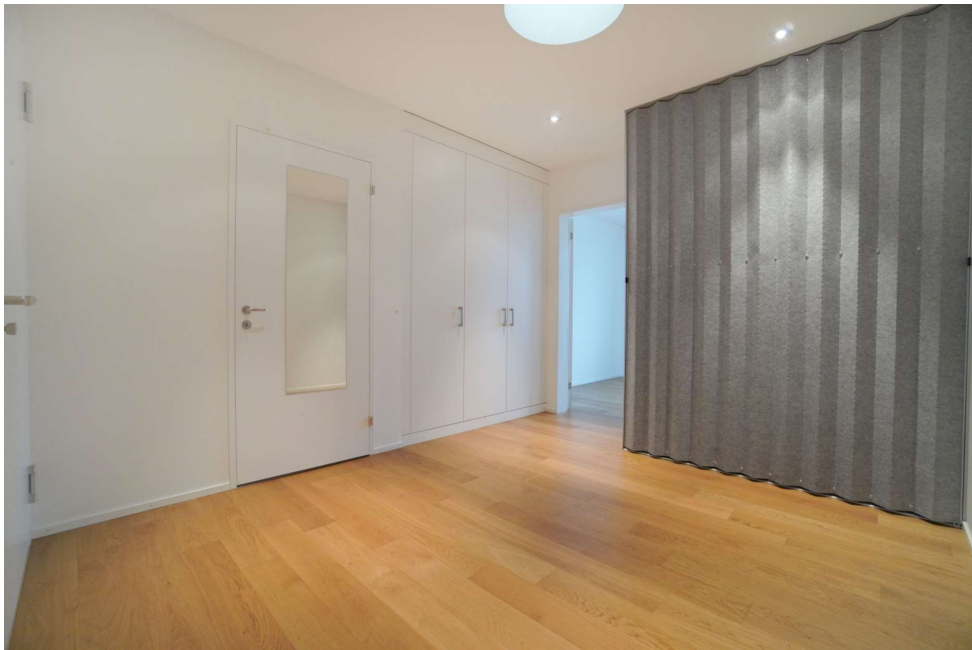
Eingangsbereich mit Oblicht und praktischer Garderobe