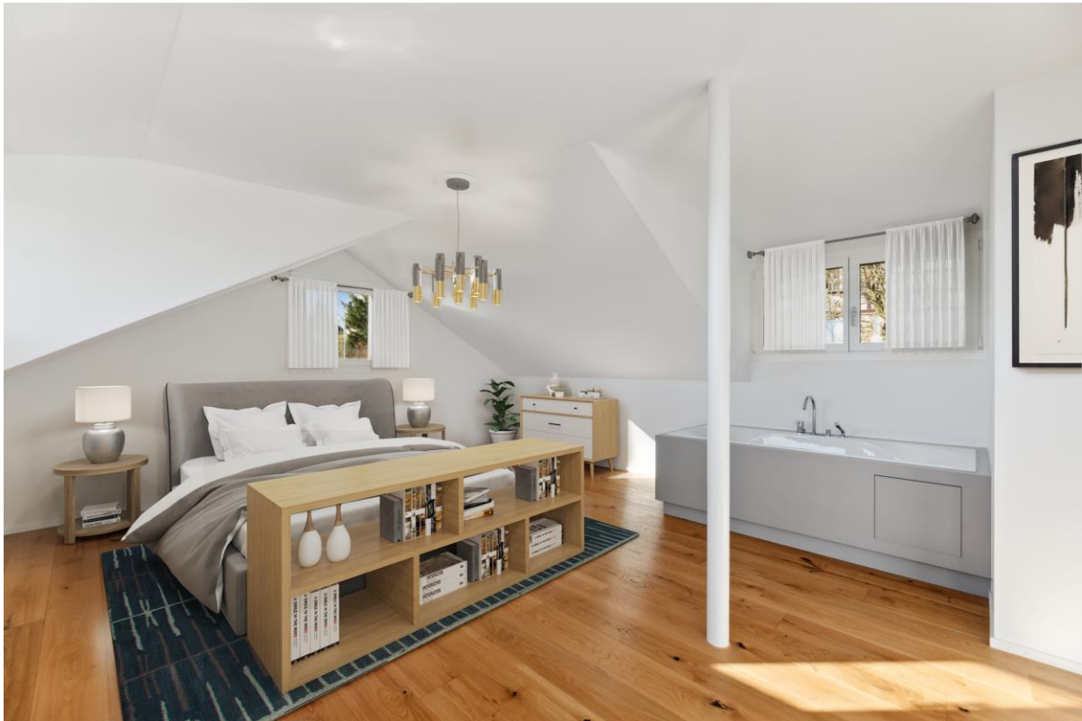
Oberes Schlafzimmer mit Whirlpool

Grosszügige Wohnung für Paare, Singles oder junge Familien an zentraler Lage in Kilchberg.