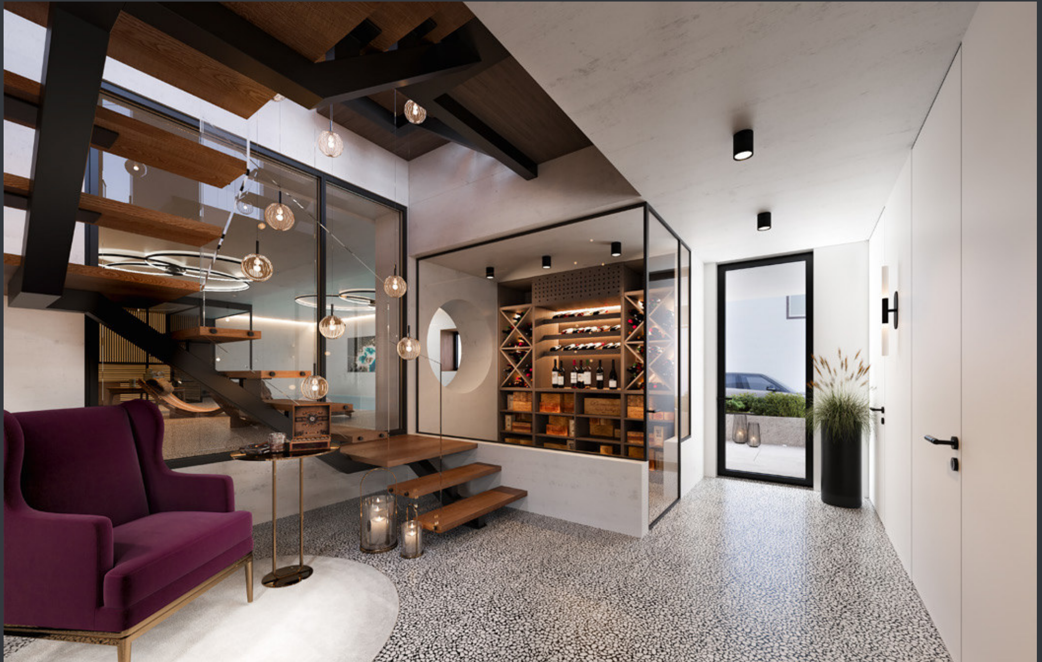
WOHNHAUS · SOCKELGESCHOSS · WELLNESS BEREICH LINKS & WEINKELLER RECHTS