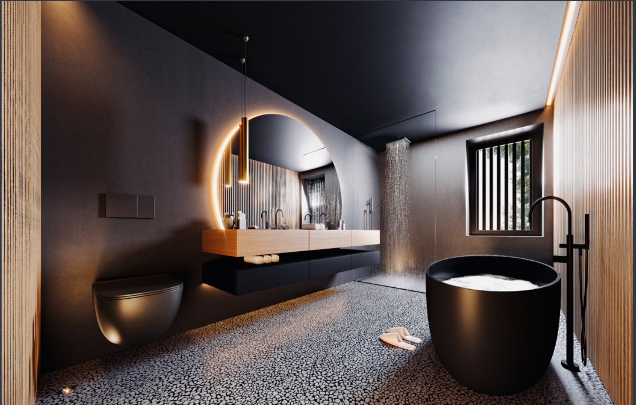
WOHNHAUS · ERDGESCHOSS · MASTER BEDROOM LINKS & MASTER BADEZIMMER RECHTS