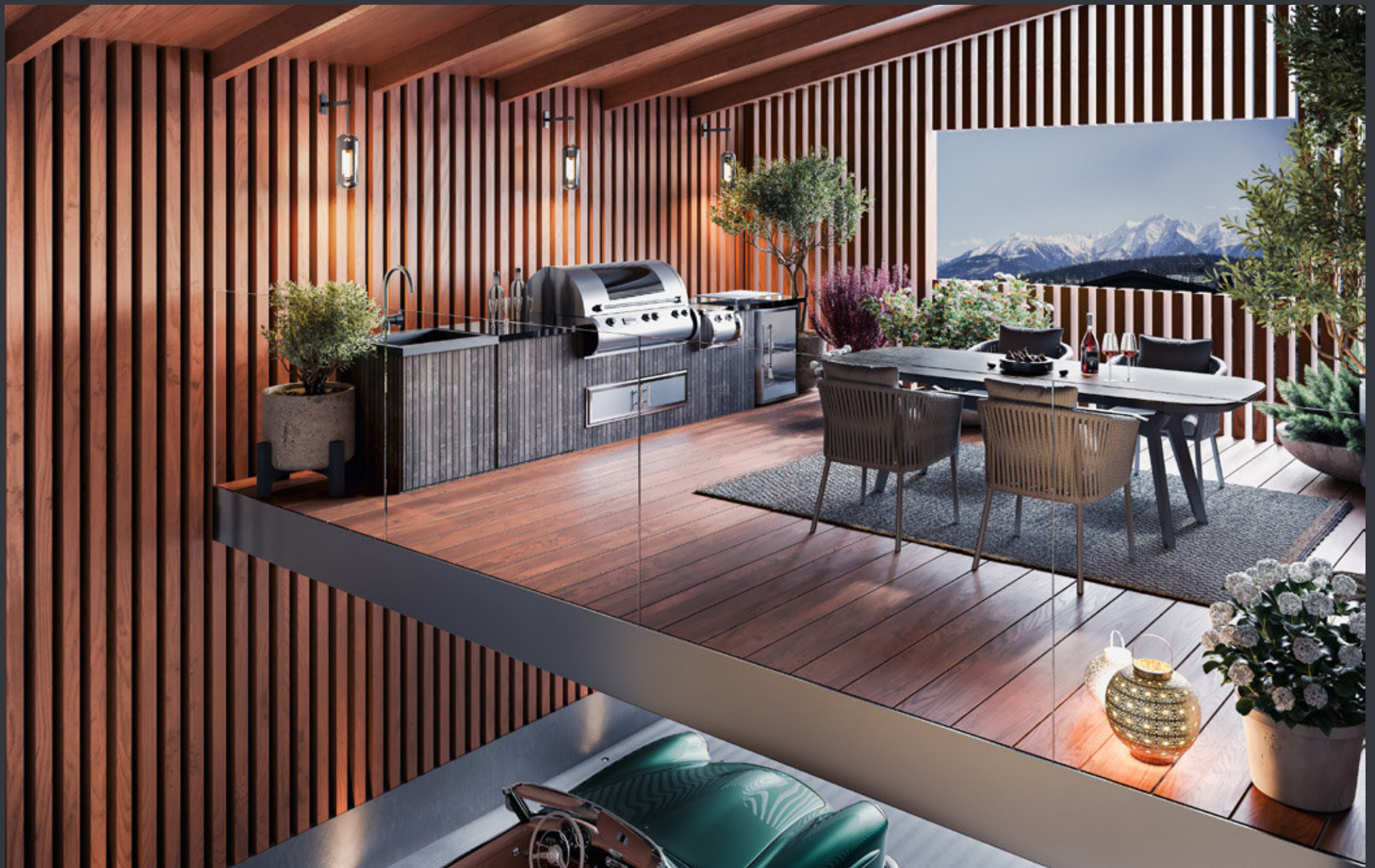
EINSTELLHALLE MIT DACHGARTEN · OBERGESCHOSS · DACHGARTEN MIT AUSSICHT AUF DIE BÜNDNER BERGE