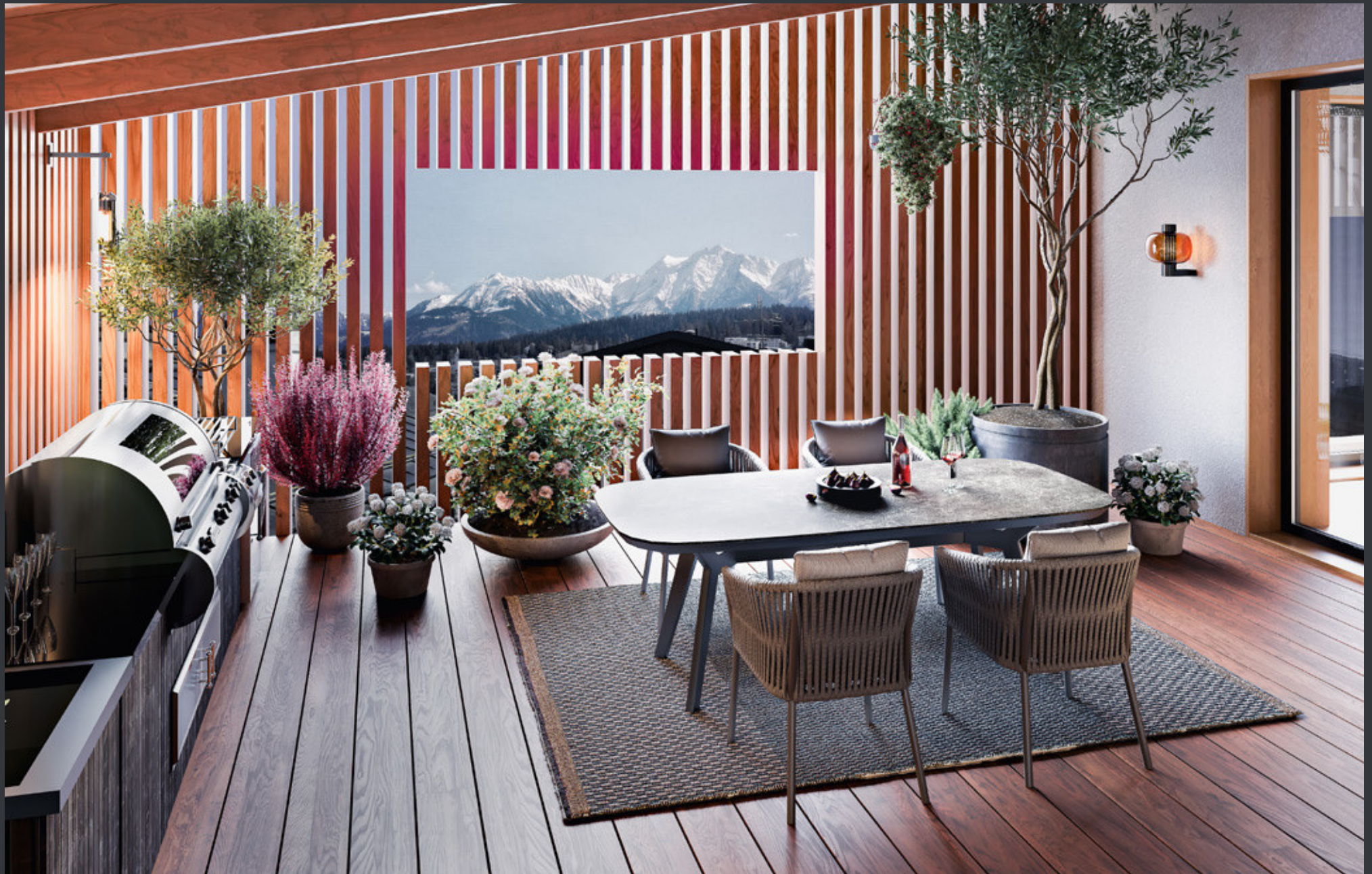
WOHNHAUS · OBERGESCHOSS · ESSBEREICH LINKS & DACHGARTEN RECHTS