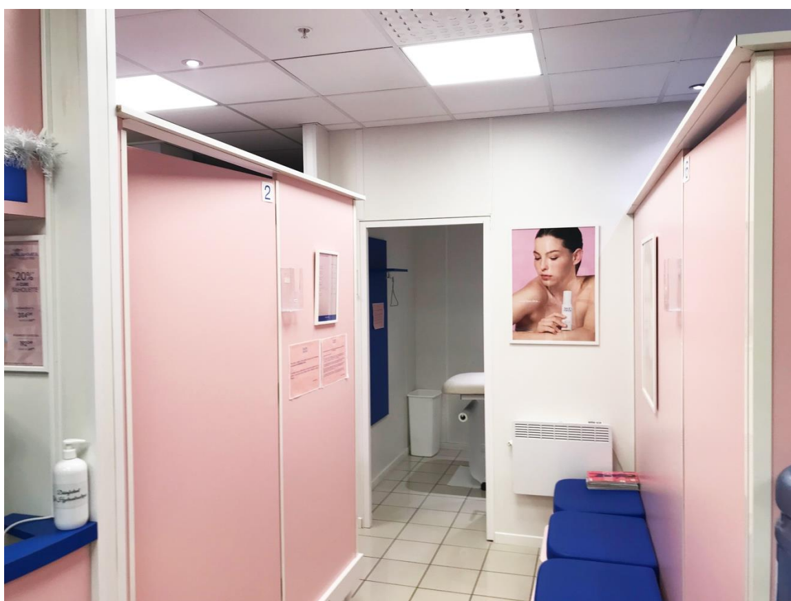
Vue sur l'espace cabines de soins à droite de l'entrée.