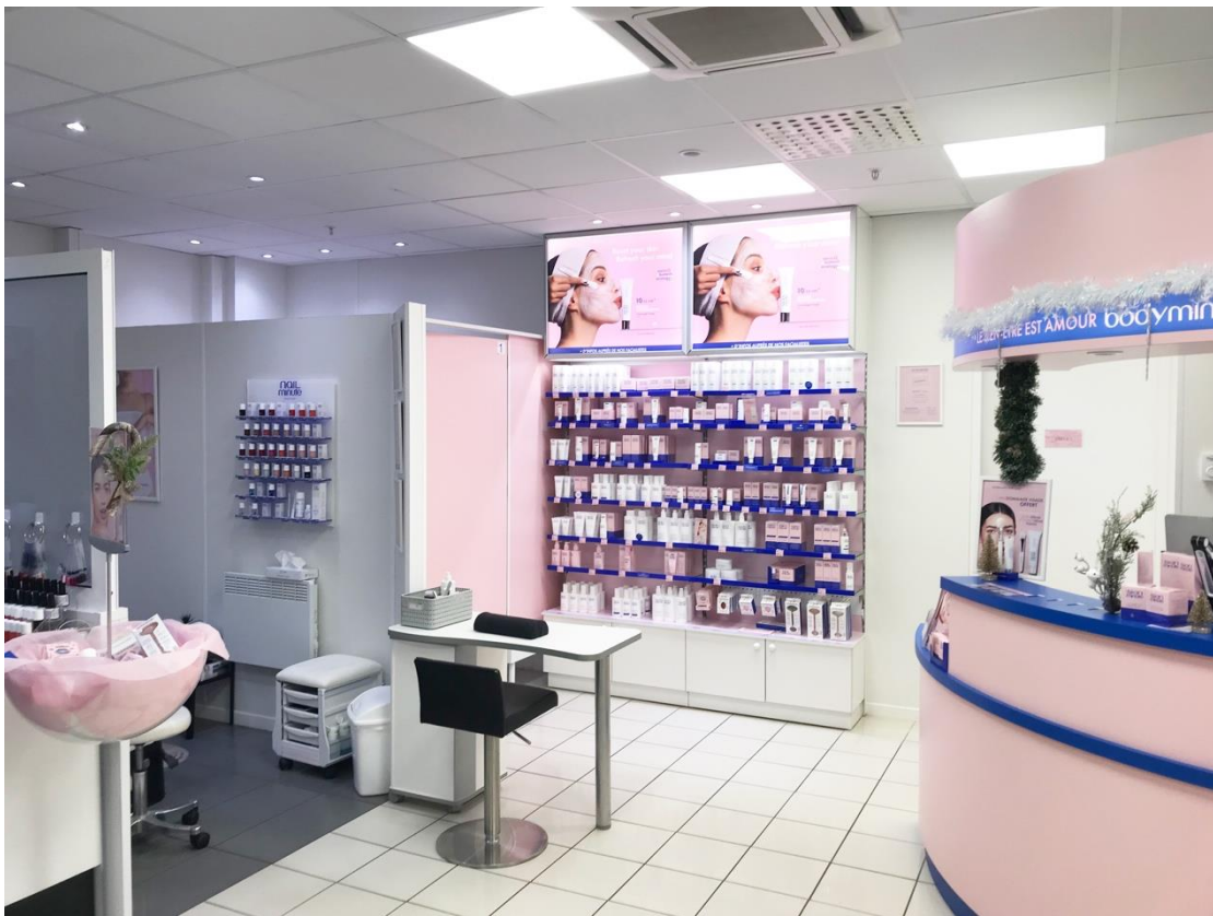
Vue depuis la porte d'entrée. La porte derrière l'accueil donne sur le bureau, l'espace de formation et la cuisine.