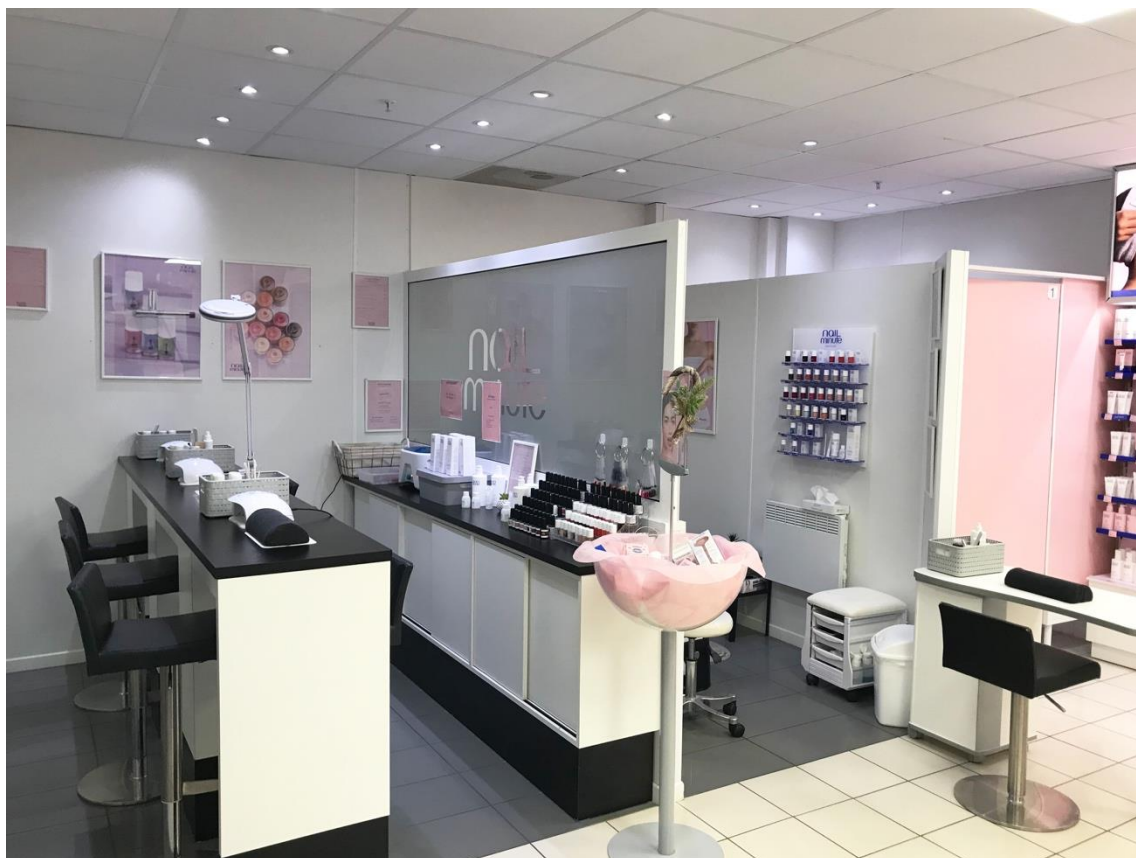
Vue sur l'espace Manucure/Pédicure à gauche de l'entrée