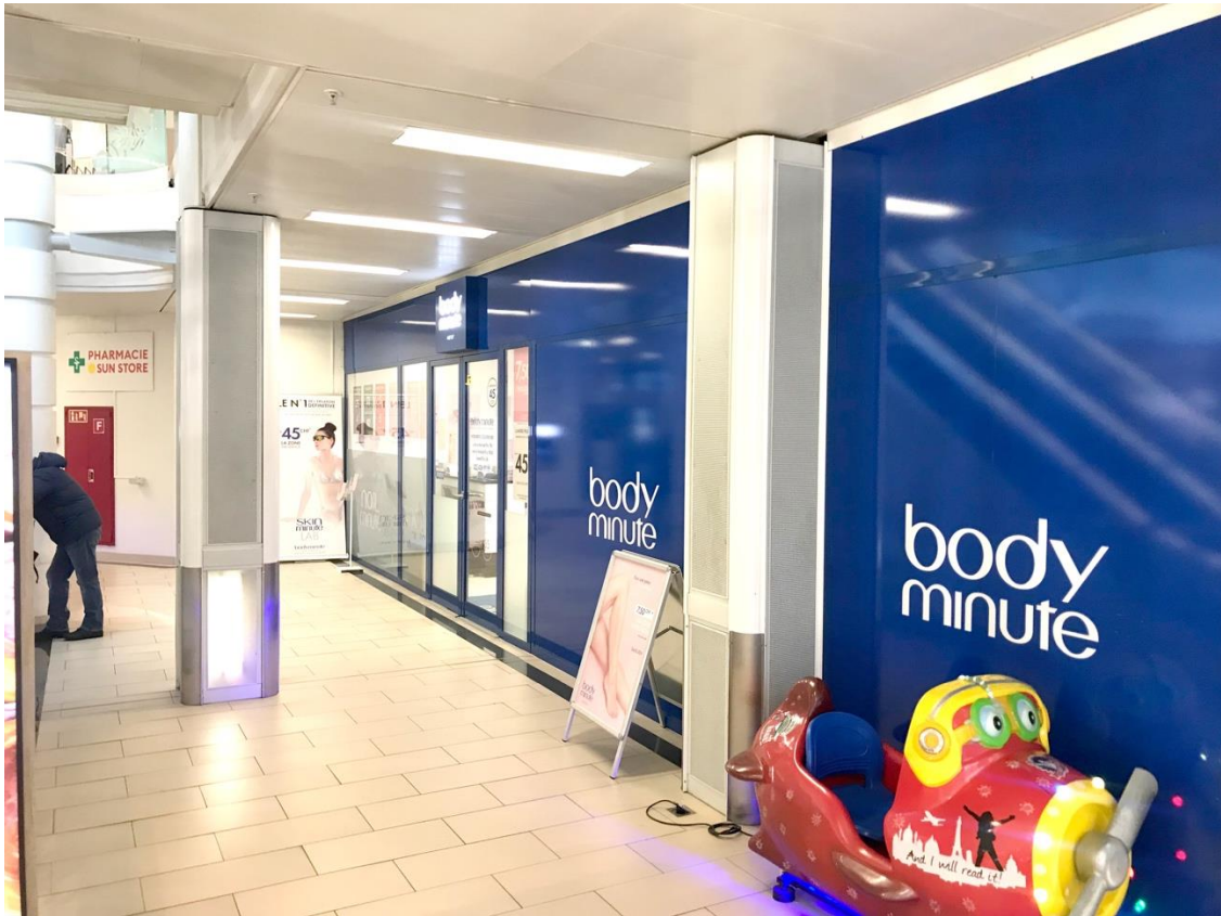
Vue extérieure sur l'entrée