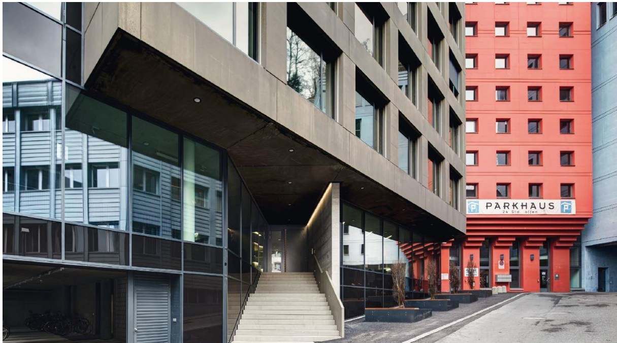
Eingangsbereich / Parkhaus