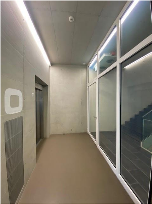
Schleuse zwischen Lagerraum/Treppenhaus