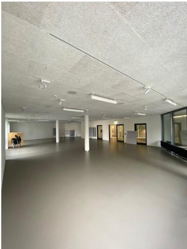
Ausstellungs- und Schulungsraum